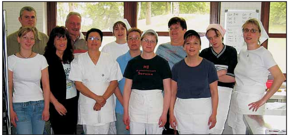
Das Team vom H1 Hauswirtschaftsservice.