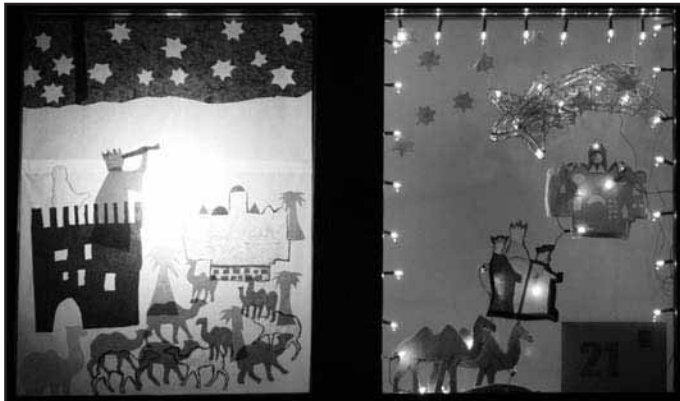
Fenster 21. Dezember