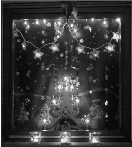
Fenster 19. Dezember