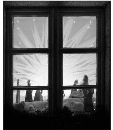
Fenster 23. Dezember