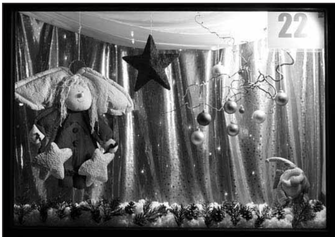
Fenster 22. Dezember