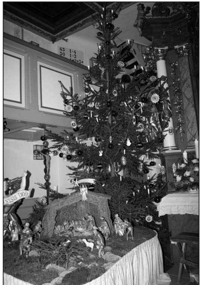
Fenster 24. Dezember