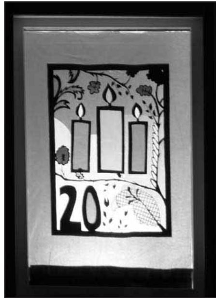
Fenster 20. Dezember