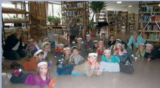
Kindergarten Froschgrün in der Stadtbibliothek Naila

Viele Kinder und mehrere Kindergärten kamen mit originellen Kostümen in die Stadtbibliothek Naila um ein Indianerfest zu feiern. Nach einer Bildergeschichte, einem Wolkentanz und indianischen Spielen konnten sich die Kinder mit goldenem Maisbrot stärken.