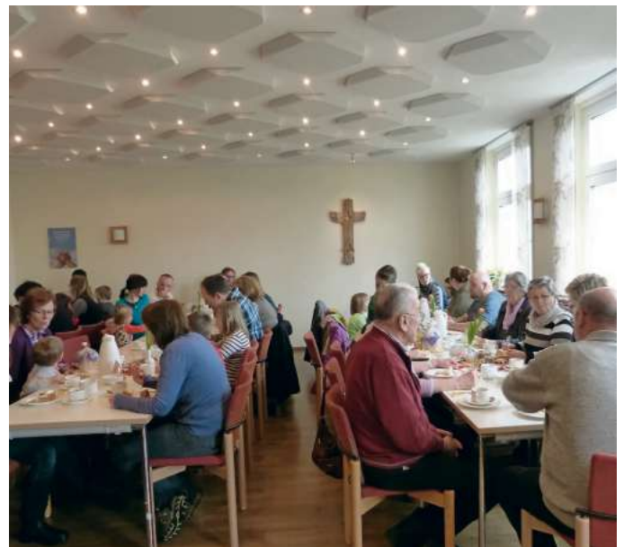
Geselliges Beisammensein im Gemeindehaus

Am Sonntag vor Ostern verstecken Mitglieder des Frankentalvereines der Ortsgruppe Lippertsgrün traditionell im Ort Osternester für die Kinder. Dazu findet ein Osterspaziergang mit anschließender gemütlicher Zusammenkunft im Gemeindehaus bei Kaffee und Kuchen statt. Trotz widrigen Wetters fanden sich