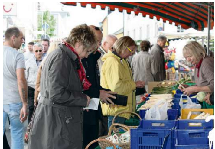
Frischer Spargel aus Franken