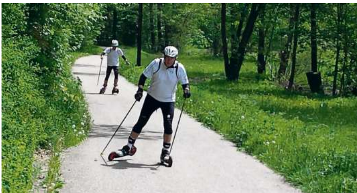
„Skiker“ auf dem Radweg Naila – Marxgrün

Skiken ist sicher durch patentiertes wirkungsvolles beidseitiges Waden-Bremssystem, TÜV-zertifiziert bis 120 kg Personengewicht. Es hat amtlich bestätigte Bremsverzögerungswerte von über 6,5 m/s 2 und ist mit Luftreifen, Durchmesser 150 mm, fahrbar. Die Verwendung von eigenen Sportschuhen (Größe 36 bis 47) ist möglich. Skiken in freier Natur macht einfach dauerhaft Spaß!