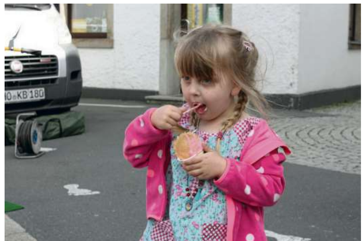
Ein „süßer Käfer“