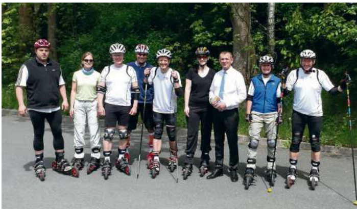
Die ersten Interessenten beim Schnupperkurs mit 1. Bürgermeister Frank Stumpf (3. v. r.)

Naila - Die Präsentation war ein großer Erfolg und fand großen Zuspruch von Jung und Alt, sogar aus Thüringen.