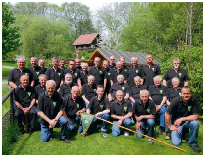
Aktuell hat der Edelweiß-Club Marlesreuth 45 Mitglieder. Auf dem Foto aus dem Jahr 2015 fehlen einige Mitglieder.

Marlesreuth -Vor 60 Jahren besuchten die damaligen Dorfburschen aus Marlesreuth einen Tanz im Nachbarort Döbra. Weil es ihnen auf dem Tanz so gut gefallen hat, beschlossen sie: „Das machen wir auch im Gasthof Böhm“. Der Tanz am 29. Januar 1955 wurde ein Riesenerfolg und so beschloss man, sich künftig regelmäßig zu treffen. Aus dieser Gemeinschaft gründete sich der Edelweiß-Club Marlesreuth. Jung, ungebunden, einen flotten Strohhut auf dem Kopf und immer ein fröhliches Lied auf den Lippen, so waren die Marlesreuther Jungspunde damals im Frankenwald bekannt. Der damalige Zusammenschluss der Ortsburschen hatte zu dieser Zeit sicher verschiedene Gründe: Geselligkeit zu pflegen und vor allem aus der Gemeinschaft heraus Aktivitäten zu entwickeln, welche damals noch nicht wie in der heutigen Zeit durch Medien, Fernsehen, Radio und Reise-möglichkeiten gegeben waren. Heute, sechzig Jahre später, sind aus den jungen Männern der ersten Stunde reife Persönlichkeiten geworden. Aber ihre Fröhlichkeit und ihre gute Laune ist weiterhin ihr Erkennungszeichen. Heuer, im Jahr 2015, können die Stammtischfreunde ihr 60-jähriges Bestehen feiern. Viel hat sich in der Zwischenzeit verändert. Hier ein Blick zurück: Jeden zweiten Dienstag im Monat