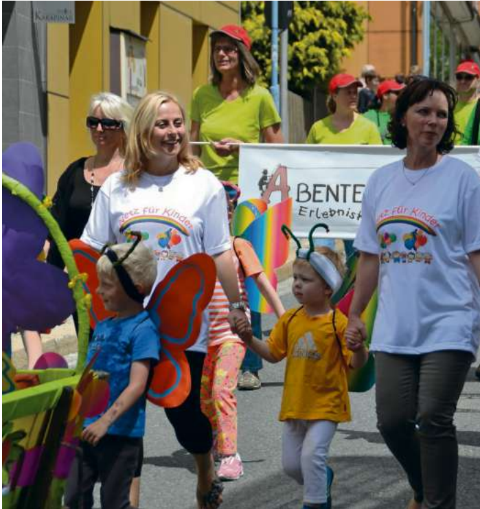
Festzug mit den Kindergärten