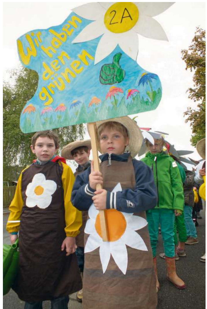
Der Festzug der Kindergarten- und Schulkinder findet am Montag statt.