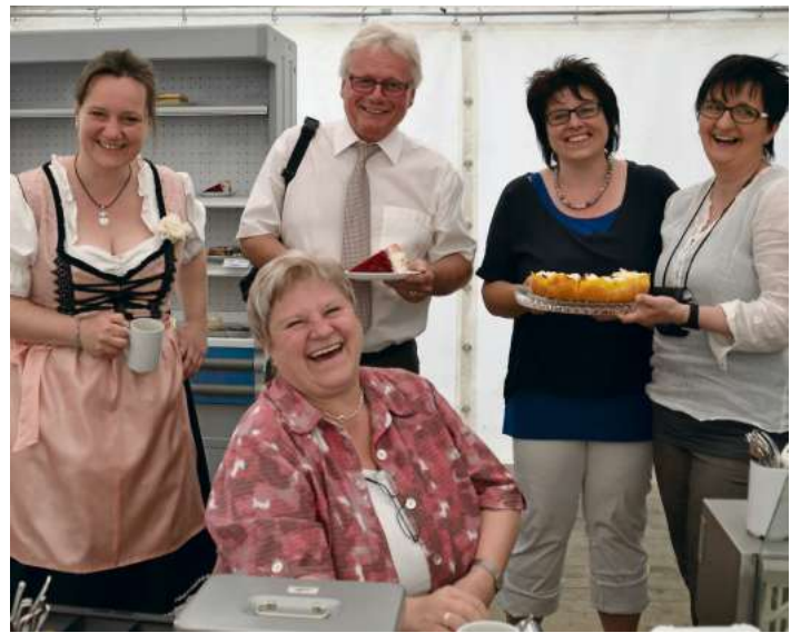
Am Samstag gibt es Kuchen vom Förderverein, am Sonntag und Montag vom Stadtrat

Aufstellung Schulstraße - Georg-Hüttner-Platz - Hauptstraße - Kriegerdenkmal - Kirchstraße - Bergwiesenstraße - Schützenstraße