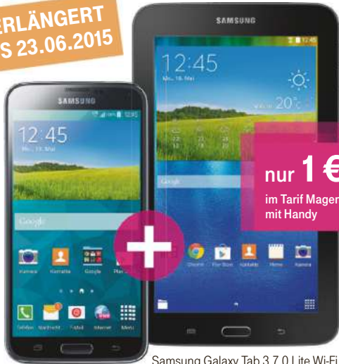
Samsung Galaxy S5 LTE+