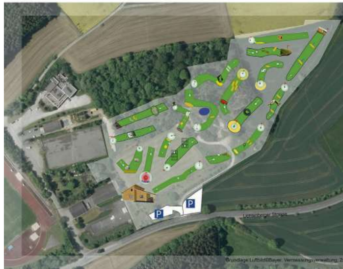
Plan der FußballGolf-Anlage

Naila - Das Betriebsgebäude steht. Im Innenbereich ist der Küchenbereich komplett fertig gestellt und auch die Zapfanlage an der Theke ist betriebsbereit. Der neue Rasen ist bereits das erste Mal gemäht worden und so entsteht hier innerhalb der nächsten Woche ein Platz, der durchaus anspruchsvoll wird, für Hobbyfußballer und Mannschaftsspieler. Ein Parcours über 18 „Löcher“ wächst hier heran. Am 10. Juli um 13 Uhr ist die offizielle Eröffnung, ab 14 Uhr heißt es dann „Ball frei“. Dabei ist Taktik und das richtige Einschätzen der eigenen Kenntnisse entscheidend, den Platz mit möglichst wenigen Schüssen zu absolvieren. Es wird an manchen Bahnen auch möglich sein, ein „Aß“ zu schießen, also den Ball mit einem Schuss einzu-