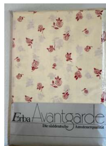
Die Bettwäsche von Erba war von hoher Qualität

1949 Einführung eines monatlichen Waschtages für Frauen bei bezahlter Freizeit. 1952 Einführung von zusätzlichen 14-tägigen Erholungsurlaub für langjährige Mitarbeiter. Auch eine Werksbücherei war vorhanden.