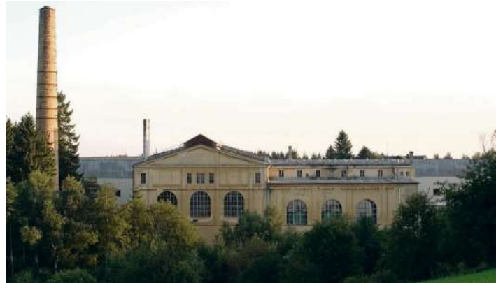
Das Maschinen- und Kesselhaus stand hinter dem Webereigebäude

Die Gesamtbruttoinvestition für die Sanierung ist mit rd. 9,85 Millionen Euro veranschlagt und bedeutet für die Stadt Schwarzenbach a.Wald einen enormen finanziellen Kraftakt. Hinzu kommen noch erhebliche Investitionen welche von REHAU selbst in die Ausstattung vorgenommen werden. Auch die Kosten für den