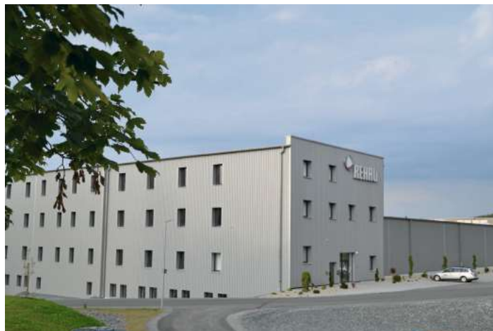
In einem schmacken Gebäude produziert jetzt die REHAU AG

Der neuere Teil der Erba-Webhallen konnte 2004 an ein anderes Textilunternehmen verkauft werden. Als sich jedoch abzeichnete, dass für die große Webhalle, das Maschinenhaus, das Direktorenwohnhaus, Pfortnergebäude und die Nebengebäude keine für die Stadtentwicklung zufriedenstellende Lösung zu erkennen war, hat der Stadtrat im Jahr 2008 das Stadtumbaugebiet ERBA beschlossen. Am 21.04.2009 erhielt die Stadt bei der Zwangsversteigerung den Zuschlag und ist seitdem Eigentümerin des ehemaligen rund 50.000 Quadratmeter großen ERBA-Geländes.