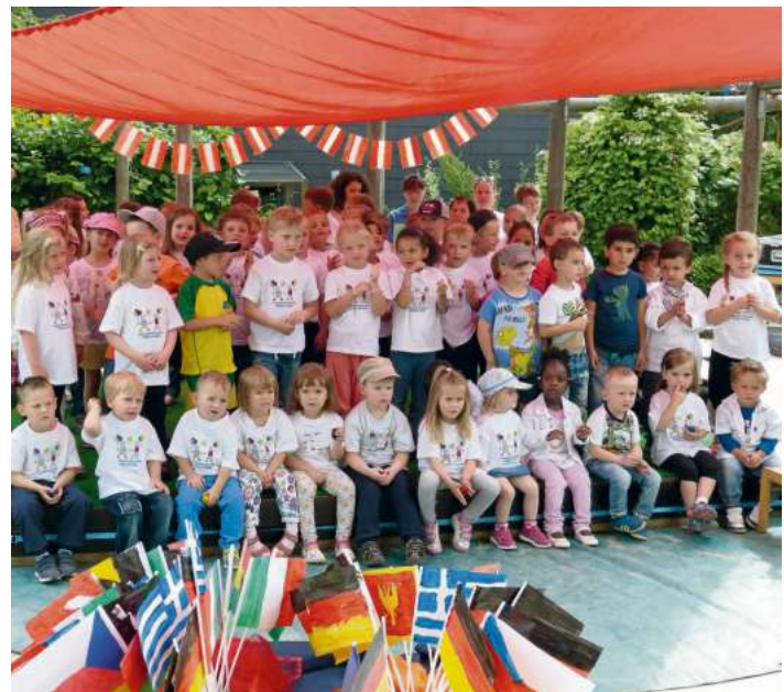
„Die Kinder dieser Welt“ im Kindergarten „Hand in Hand“