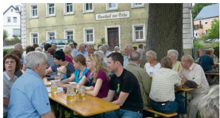
Gut besucht war der „Aachela-Gardn“ in Lippertsgrün

Beim Fest im „Aachela-Gardn“ in Lippertsgrün war wieder viel los. Im letzten Jahr hatte hier der Frankenwaldverein zusammen mit der Stadt Naila den Platz in der Ortsmitte wieder zu einem beliebten Treffpunkt für die Be-