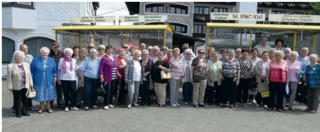
Gruppenfoto vor Hotel und hoteleigenen Bimmelzug