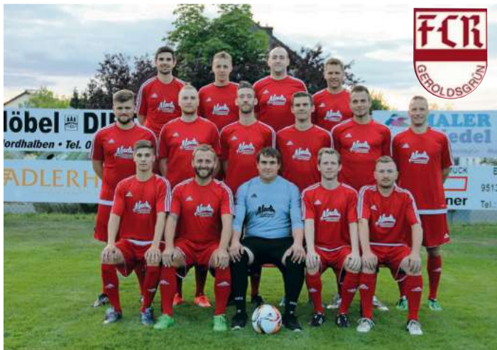
Die erste Mannschaft des FCR Geroldsgrün mit den neuen Trikots des Aladin Lieferservice aus Schwarzenbach/Wald.