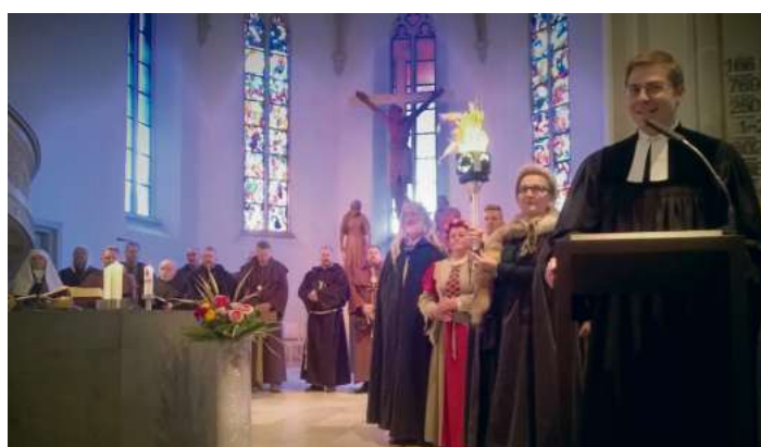
Eine Lichtenberger Abordnung, bestehend aus Fanfarenbläsern, Bibamus-Mönchen und vielen Lichtenbergern in mittelalterlichen Gewändern, begleitete die Fackel zum Gottesdienst in die Stadtkirche Naila.