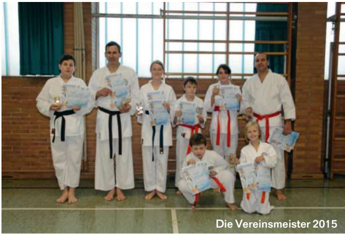
Die Vereinsmeister 2015