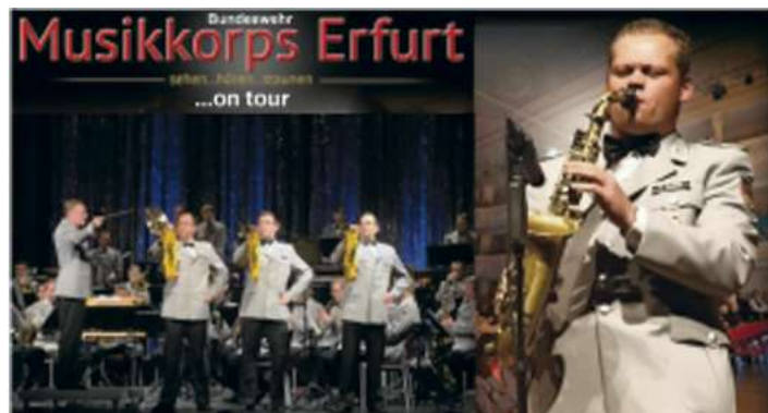
Konzert in der Frankenhalle Naila am 20. März mit dem Heeresmusikkorps der Bundeswehr

schule zu Gute. Der Vorverkauf läuft bereits. In der Geschäftsstelle der Ferienregion Selbitztal-Döbraberg im Nailaer Rathaus, bei Büro Mohr in Naila und in der Grundschule Naila. Die Karten kosten im Vorverkauf für Kinder, Jugendliche, Studenten und Behinderte vier Euro, an der Abendkasse fünf Euro und für Erwachsene acht Euro, an der Abendkasse zehn Euro. Die 241 Schüler der Nailaer Grundschule dürfen das Konzert kostenlos besuchen.