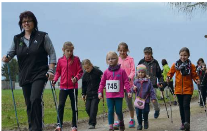
Auch eine geführte Kindergruppe wird wieder angeboten

Schwarzenbach a. Wald - Der Wintersportverein erwartet am Samstag, 23. April ab 13 Uhr wieder viele Lauffreunde aus nah und fern zum 12. Nordic Walking Halbmarathon. Rund um den Döbraberg könnten die Teilnehmer auf vier verschiedenen Strecken (5, 7, 12 und 21 km) ihre Fitness testen und dabei das Panorama des Döbraberges im Frühling erleben. Die Veranstaltung steht unter dem Motto: Breitensport für alle, ohne Wettkampf- und Leistungsdruck. Die Teilnehmer entscheiden selbst, ob sie als Jogger, Walker oder als Nordic-Walker teilnehmen möchten. Die 21 km Strecke die über den Döbraberg und den Rodachran-