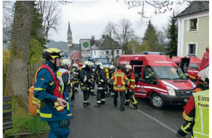
Das Foto zeigt die Großübung an der Mittelschule Frankenwald.