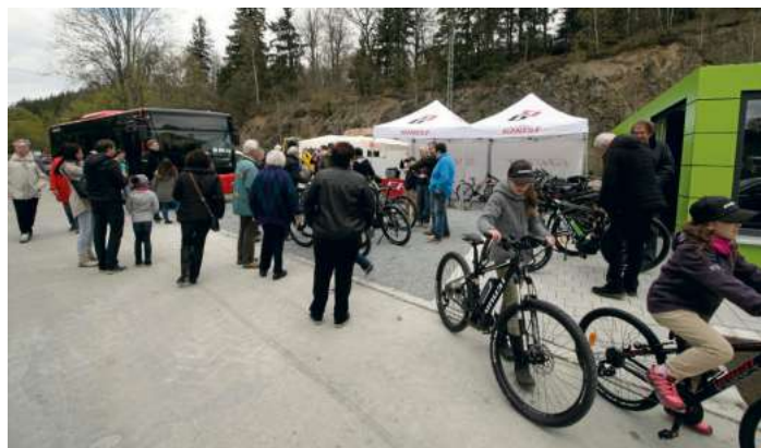
Die Bikerbox fand regen Zuspruch

Der Bahnhof als neues Tor zur Stadt Naila liegt zentral am Selbitz Radweg. In der Wartehalle befindet sich das neue touristische Zentrum für die sieben Gemeinden und Städte der Ferienregion: Naila, Selbitz, Schwarzenbach am Wald, Köditz, Issi-