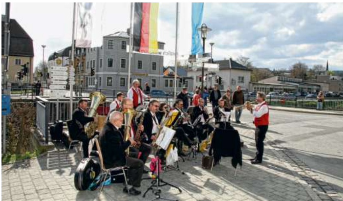
Die Marlesreuther Blaskapelle sorgte für musikalische Unterhaltung