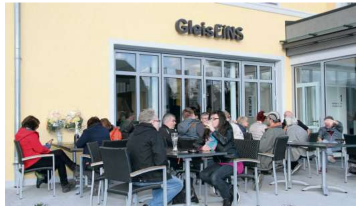
Viele Besucher genossen das schöne Wetter vor dem Restaurant Gleis Eins

Naila - Innovation braucht Mut und Visionen. Als der Nailaer Stadtrat vor über vier Jahren den richtungsweisenden Beschluss unterzeichnete, das leer stehende Bahnhofsgebäude zu erwerben, bewies er, dass man im Frankenwald an die Zukunft des Tourismus glaubt. Damals konnte sich die Bevölkerung noch nicht vorstellen, welches Schmuckstück heute entstanden ist.