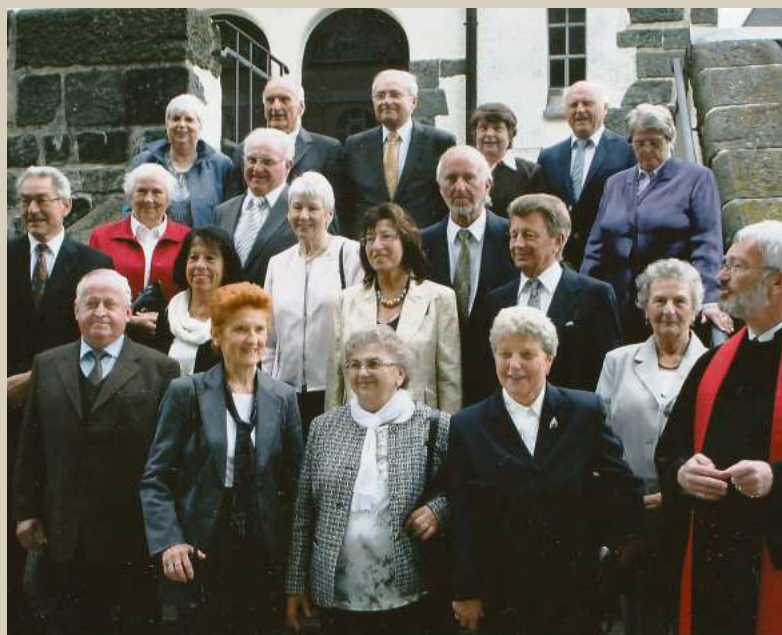
Bad Steben, im Mai 2016