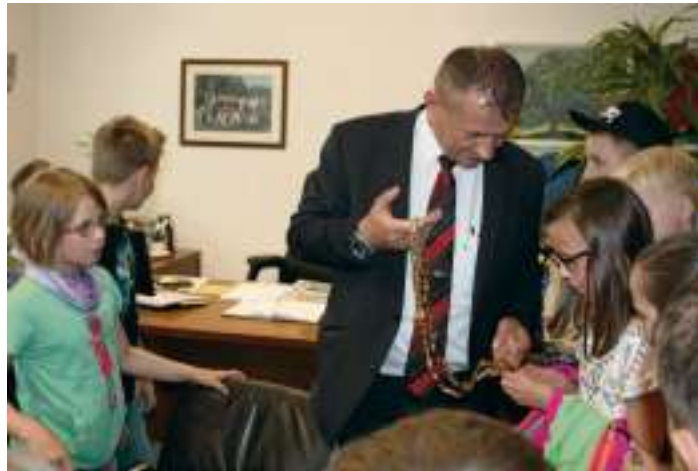
Die Kinder der Klasse 4a der Grundschule Naila im Amtszimmer mit dem 1. Bürgermeister der Stadt Naila Frank Stumpf.

In der Schulstunde im Rathaus mit dem 1. Bürgermeister erfuhren die Schüler unter anderem auch, von wem die Stadt Naila die Kette des Bürgermeisters als Geschenk bekam, woher die Berufsbezeichnung des Stadtkämmerers stammt, wie