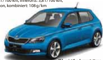
Abb. zeigt Sonderausstattung

*gegenüber der UVP des Herstellers vor Erstzulassung