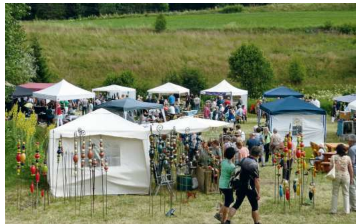
Auf dem Gelände der Culmitzhammermühle konnten sich die Besucher viele Tipps und Ideen zur Gartengestaltung anschauen.

Bereits zum 17. Mal wurde das außergewöhnliche Gartenfest mit Gartenmesse im Anwesen von Hannelore Grafen-Walther in Culmitzhammer veranstaltet. Der unverwechselbare Charme von LandArt lockte auch diesmal an beiden Tagen wieder zahlreiche Besucher aus ganz