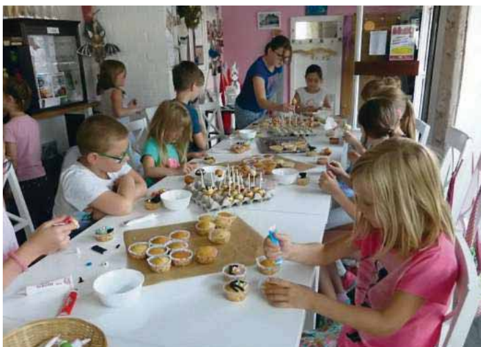
Das Foto zeigt die Kids beim Cupecake dekorieren im Café Memories

sich unter anderem die Möglichkeit, mit einem Schlauchboot zu fahren, man konnte verschiedene Vereine kennenlernen, die Polizei besichtigen, Zorbingbälle testen und noch vieles mehr.