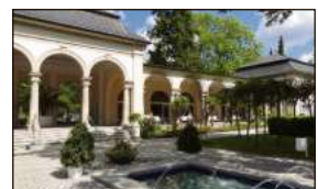
ImmobilienSHOP Bad Steben Mo, Mi, Fr, jew. 14-18h oder nach V.