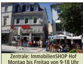
Zentrale: ImmobilienSHOP Hof Montag bis Freitag von 9-18 Uhr