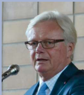
Bürgermeister Dieter Frank