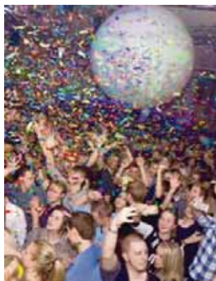
Party in Blankenstein