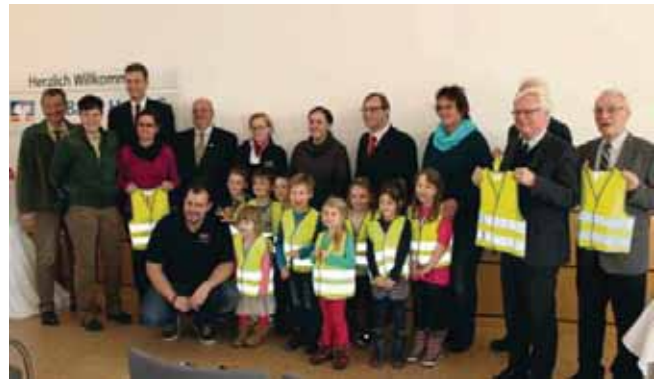
Übergabe von 500 Warnwesten an Kindergärten aus dem Landkreis Hof

Hof - „Für meine Sicherheit machen sie sich stark!“ so lautet die Bedruckung auf dem Rücken der neongelben Warnwesten die auch in diesem Jahr wieder an verschiedene Kindergärten kostenlos verteilt wurden. Dadurch werden die Kinder im Straßenverkehr für alle Verkehrsteilnehmer deutlich sichtbarer und so vor Unfällen geschützt – vor allem in der dunklen Jahreszeit. Zur Übergabe von 500 Westen trafen sich kürzlich kleine und große Vertreter von Kindergärten aus Stadt und Landkreis Hof mit den Sponsoren VR Bank Hof, Radio Euroherz und BRK Kreisverband Hof. Folgende Ein-