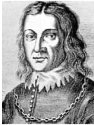
Johann IV. Markgraf zu Brandenburg und Kulmbach