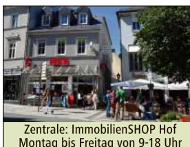
Zentrale: ImmobilienSHOP Hof Montag bis Freitag von 9-18 Uhr