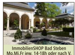
ImmobilienSHOP Bad Steben Mo, Mi, Fr jew. 14-18h oder nach V.