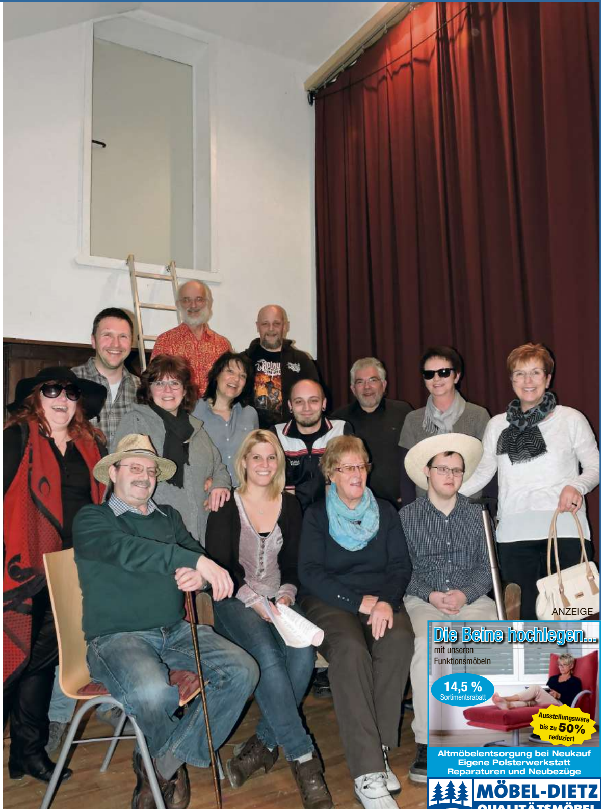
Titelfoto: „Geräuchertes mit Sauerkraut“ – neues Stück der Theatergruppe Lichtenberg, Premiere am 27. Februar