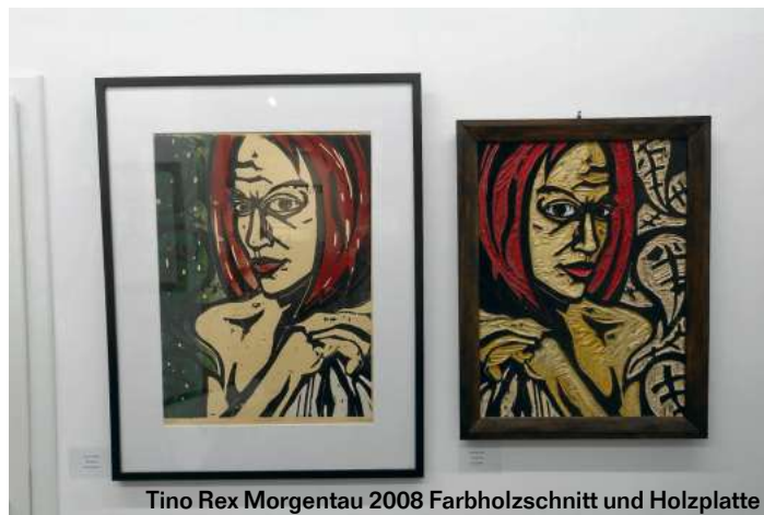
Tino Rex Morgentau 2008 Farbholzschnitt und Holzplatte

Die Aktfotografie, kann zum Beispiel durchaus ein skeptisches Thema sein. Jedoch ist die Aktkunst heute kein Anschlag auf die öffentliche Moral mehr. Dass der weibliche Akt in der bildenden Kunst bevorzugt wird hat wohl etwas mit der Anmut und Schönheit und dem Ausdruck der fe-