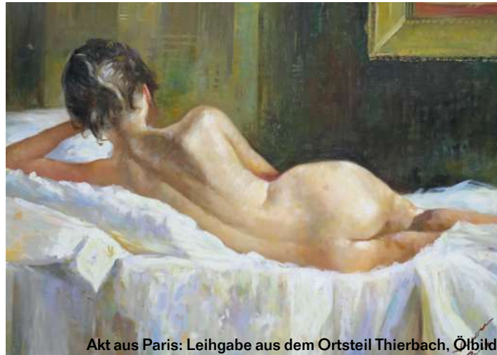
Akt aus Paris: Leihgabe aus dem Ortsteil Thierbach, Ölbild

Die Darstellungen des weiblichen Aktes spielen im Werk Lucas Cranachs d.Ä. eine wichtige Rolle, und Michelangelos Erschaffung des Adams in der Sixtinischen Kapelle ist weltberühmt. Also Aktbilder gibt es schon solange es den Menschen gibt. Sind diese Abbil-