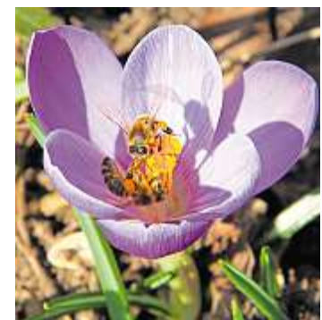
Es gibt Hoffnung für die Honigbiene.