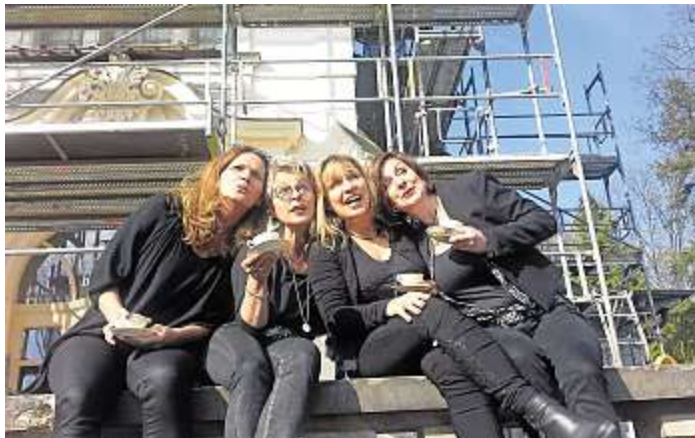
Satirische Lieder und ein treffsicheres Mundwerk: Die vier Damen von Intakt sind am 20. April im Philipp-Wolfrum-Haus.

Die vier Damen beobachten unglaublich präzise, verwandeln kunstvoll Klischees und Triviali-