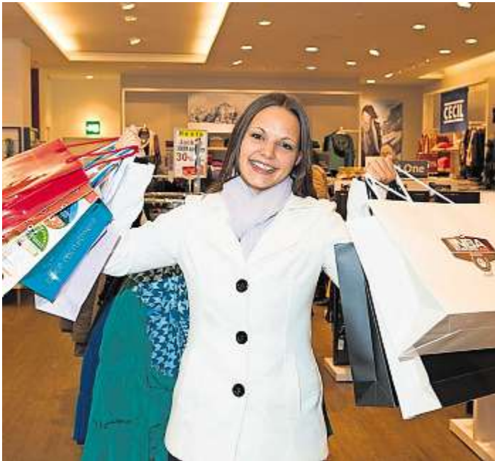
Regionaler Einkauf stärkt die heimische Wirtschaft.