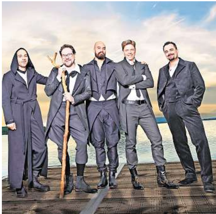
Ein Stück des Weges heißt das neue Programm der A Capella-Band Viva Voce, mit dem sie am 4. Mai nach Hof kommen.

Die Spielorte sind weiterhin Kirchen wie auch historische Denkmäler, die seit jeher mit spirituellen Erfahrungen verknüpft sind und durch eine besondere Akustik bestechen. Der Konzertsaal wird zum „Klang-Raum“, der für die sorgfältig ausgewählten Musikstücke den entsprechenden Rahmen darstellt. Der gesamte Raum wird musikalisch zum Leben erweckt, die indivi-