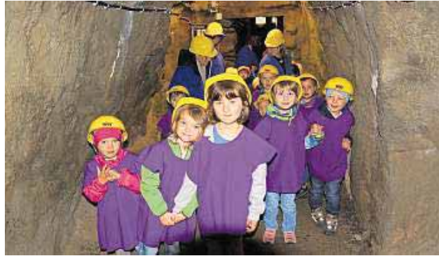
Das Besucherbergwerk hat für Kinder einige Überraschungen.