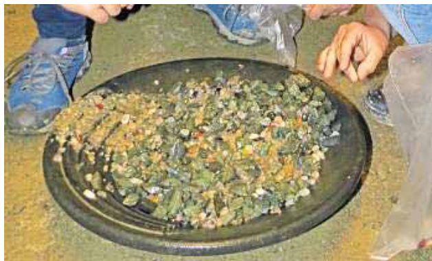
Die beim Edelsteinbuddeln ausgegrabenen Steine dürfen behalten werden.