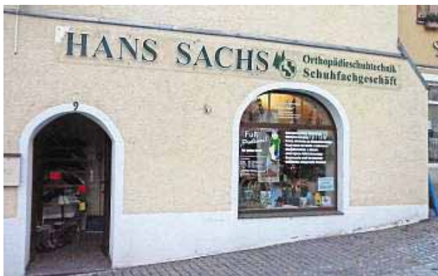
Die Außenansicht der Filiale in Bad Lobenstein.

Durch den Zusammenschluss mit der PGH "Fußbekleidung" in Schleiz 1963 wurde eine gute Entscheidung für die weitere Arbeit und Zukunft beider Betriebe geschaffen. Bis Ende der 80er Jahre arbeiteten fast 40 Mitarbeiter im Betrieb. Auf die