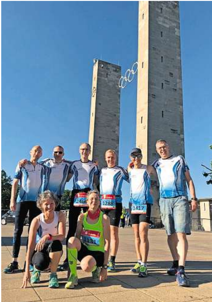
Nailaer Triathleten in Berlin und Vancouver