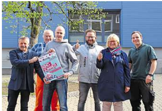
Sie alle engagieren sich für den Kinosommer in Schwarzenbach a. Wald.

Schwarzenbach a. Wald – Die Vorbereitungen laufen, es muss viel organisiert werden, wenn zum ersten Mal der Euroherz Kinosommer in Schwarzenbach a. Wald Station macht. Austragungsort ist der Innenhof der Grund- und Mittelschule. Dort stehen dann die riesige Leinwand und hunderte von Stühlen. Für Verköstigung in allen Variationen ist gesorgt.