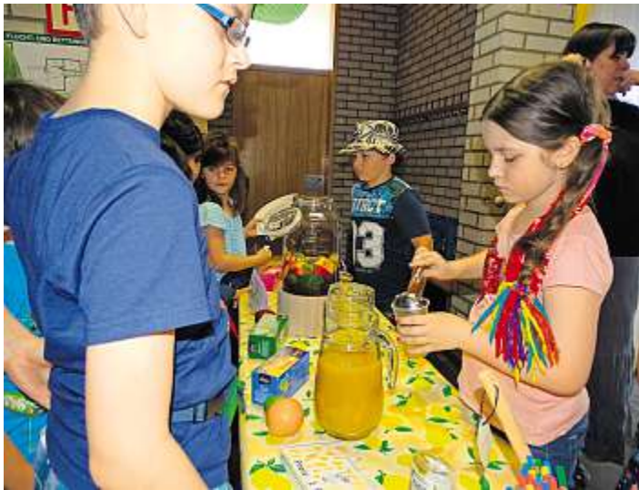
An der Eisteebar gab es fruchtige Drinks