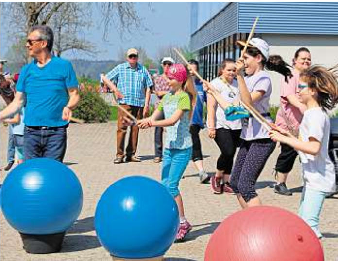
Trommelwirbel auf Gymnastikbällen war der Hingucker im Pausenhof

Schwarzenbach a.Wald – Mach mit hieß es beim Schulfest für alle Besucher. Es gab Spiele für Groß und Klein am laufenden Band. Klassenzimmer, Turnhallen, Pausenhof und die Sportanlagen wurden genutzt, um den Besuchern ein weitläufiges Programm zu bieten. Bei der Non-