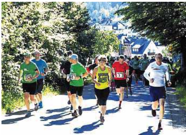
Der Hahnenkammlauf bietet für Läufer, Walker, Nordic Walker und Wanderer unterschiedliche Strecken.

Die Streckenführungen unterschiedlicher Schwierigkeitsgrade bieten viele "Points of Interest"