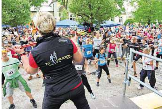
Das Archivfoto zeigt das WarmUp für den Massenstart.

Insbesondere bei Nordic-Walking- und Laufgruppen erfreut sich der Walking-Tag in Bad Steben stetig wachsender Beliebtheit. So erwarten die Ausrichter vom TSV Carlsgrün und der Tourist-Information Bad Steben erneut mehr als 300 Teilnehmer. Als Gruppen können sich nicht nur Vereine, sondern auch Firmen und Freundeskreise anmelden. Auch in diesem Jahr locken die beiden 5,3 und 10,9 Kilometer langen Strecken zum gemeinsamen Sport inmitten des Naturparks Frankenwald. Der TSV Carlsgrün hat zwei landschaftlich reizvolle Touren aus-