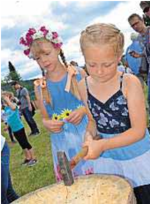
Genauigkeit ist beim Nägel klopfen gefragt.