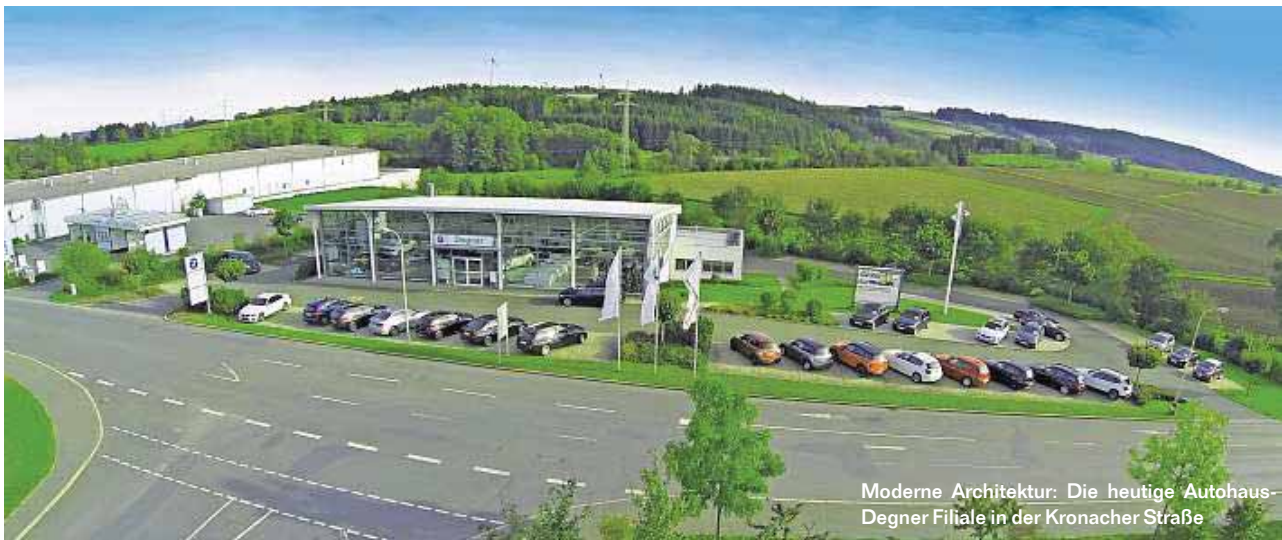
Moderne Architektur: Die heutige Autohaus-Degner Filiale in der Kronacher Straße

Freude am Fahren: 50 Jahre Autohaus Degner in Naila