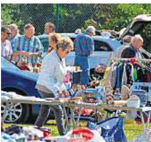
Beim Flohmarkt können Schnäppchenjäger das eine oder andere entdecken.