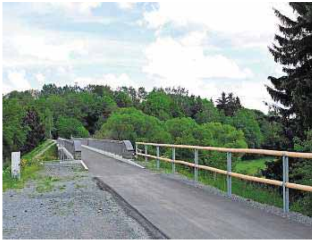
Der Geh- und Radweg führt über die sanierte Bogenbrücke und bald weiter an der Marmormühle vorbei zum Bahnhof Naila.