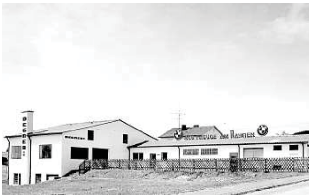
Seit 50 Jahren fest mit der Stadt Naila verbunden.