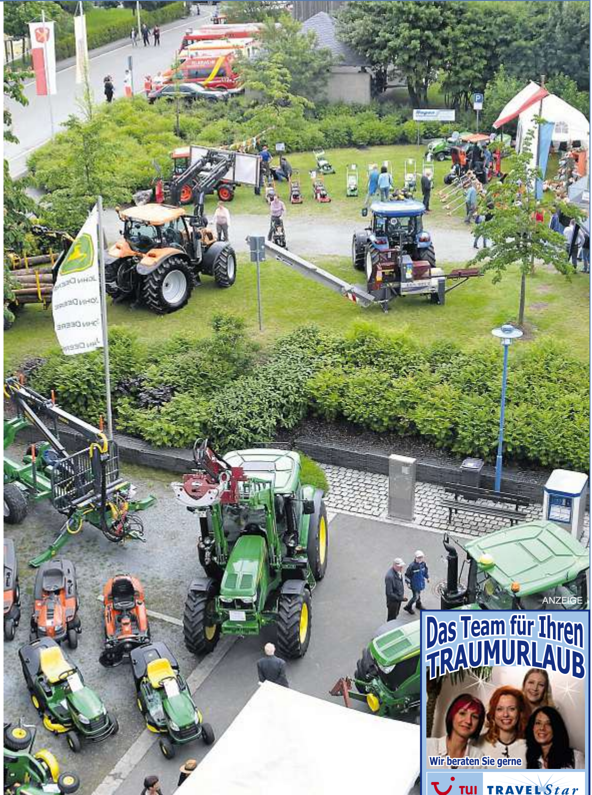
Titelfoto: FrankenWALDtag in Schwarzenbach a.Wald am 17. Juni – alles rund ums Holz