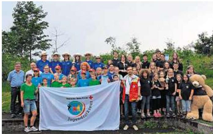
Die Sieger des BRK-Bezirkswettbewerbs.