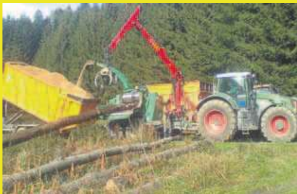
Hackschnitzelherstellung – Containertransporte – Logistik

390 PS – 10 m Kran – Einzug 80 x 140 cm inklusive aufgebautem Holzspalter!