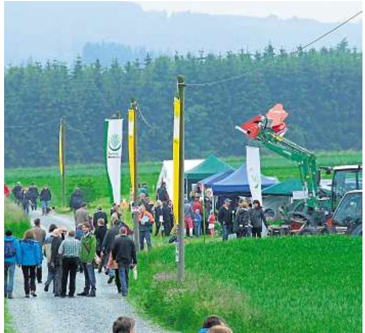
Auf dem Weg zum Waldparcours.