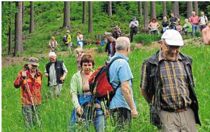
Exkursion im Quellgebiet der Wilden Rodach.

Auf dieser Feuchtwiese im Talgrund, die früher landwirtschaftlich genutzt wurde, wachsen viele seltene und auch geschützte Pflanzen. Einmal im Jahr wird diese im Spätsommer, wenn die Samen ausgefallen sind, vom Landschaftspflegeverband gemäht. „40 bis 50 Pflanzenarten haben sich hier angesiedelt“, weiß Brütting zu berichten und zeigt unter anderem die Perückenflockenblume, die Kuckuckslichtnelke, das Breit-