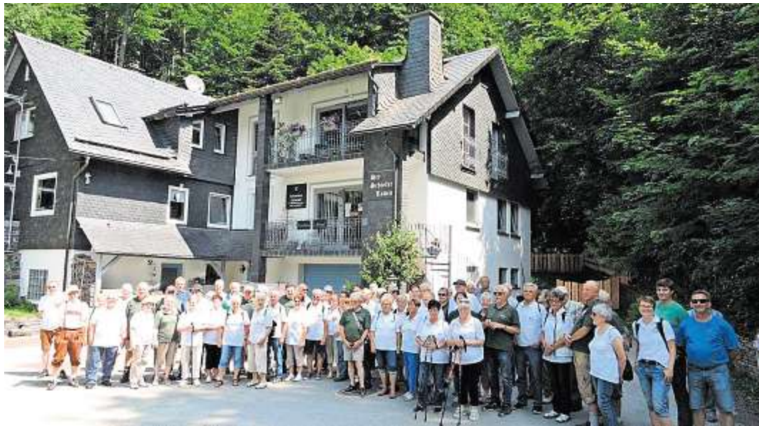
Teilnehmer des Dreiländertreffens aus den Frankenwaldvereinsortgruppen Blankenberg, Antonstal, Wallenfels und den Gastgebern Dürrenwaid vor dem Schieferladen im Schieferwerk Lotharheil.