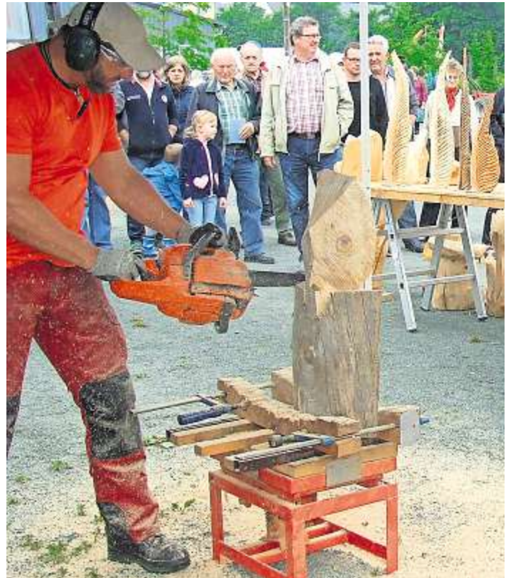
Holzskulpturen werden künstlerisch.

Weitere Infos im Internet oder Facebook unter holzforum-schwarzenbach-wald.de .