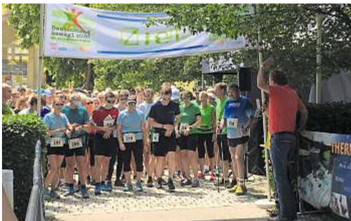
350 Teilnehmer kamen zum deutschlandweiten Walking Tag

Bad Steben - Auch in diesem Jahr beteiligte sich das Bayerische Staatsbad Bad Steben gemeinsam mit dem TSV Carlsgrün /Frankenwald am deutschlandweiten Walking-Tag. Bei Sonnenschein durften die Veranstalter der Tourist-Information vom Markt Bad Steben und des TSV Carlsgrün am vergangenen Wochenende mehr als 350 Teilnehmer im Kurpark begrüßen. Damit wurde wieder ein neuer Teilnehmer-Rekord erreicht. Jubeln durften in diesem Jahr vor allem die zahlreichen Teilnehmer aus den Bad Stebener Reha-Kliniken. Mit 125 Sportlern waren die Kliniken Auental, Franken und Klinik am Park vertreten. So ging auch der Preis für die teilnehmerstärkste Gruppe an die Klinik Franken. Jeder der 53 Walkerinnen und Walkern erhielt ein Bad Stebener Genuss-Körbchen mit regionalen Leckereien. Doch auch bei den Teilnehmern aus der Klinik am Park war im Nachhinein die Freude groß. Mit fünf Nachmeldungen,