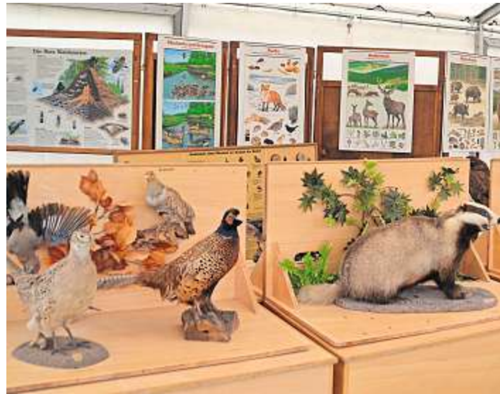
Das sind unsere einheimischen Tiere.