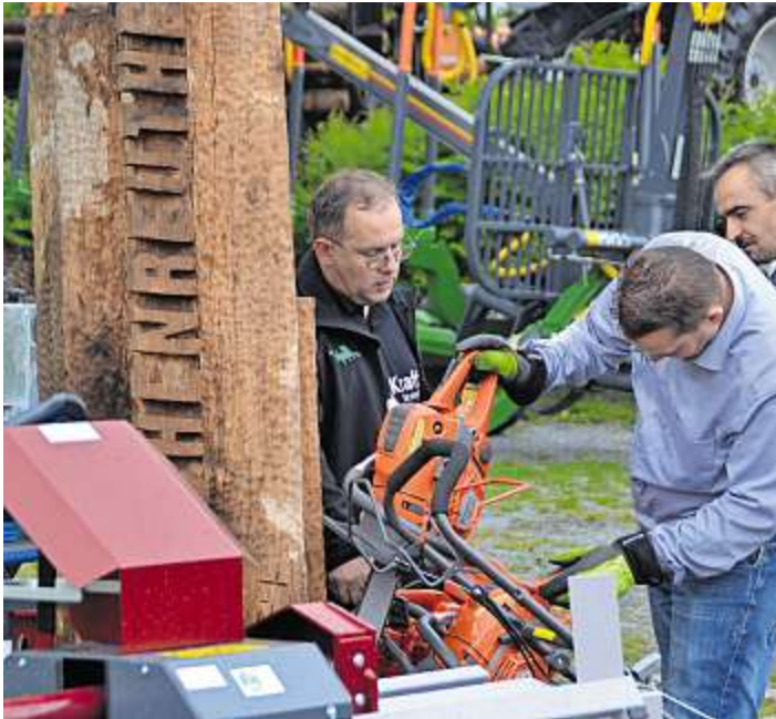
Zubehör für Landwirtschaft und Forst.