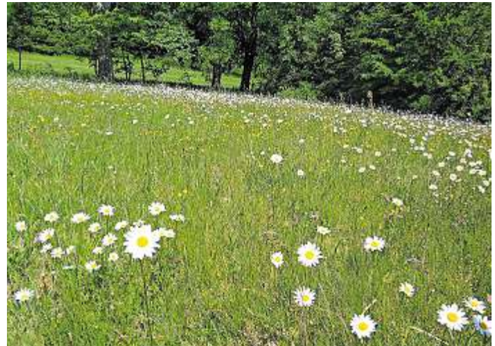
Das Foto zeigt eine blühende Magerwiese im Stebenbachtal.

Die Untersuchung wird auf 15 verschiedenen Farmen durchgeführt und für die nächsten fünf Jahre genau beobachtet. Etwa alle 100 Meter ist ein Streifen zwischen den Feldern mit Flockenblumen, wilden Möhren, Margeriten, rotem Klee und vielen weiteren wilden Pflanzen. Die landwirtschaftlichen Maschinen könnten diese Zonen problemlos auslassen, sodass die Blumen mehrere Jahre unberührt bleiben können. Die Menge an Wespen, Bodenkäfern und Schwebfliegen werden durch die Wildblumestreifen zunehmen. Diese Insekten sind die natürlichen Fressfeinde der Schädlinge. Wenn die Annahme richtig ist, fressen die Insekten die Schäd-