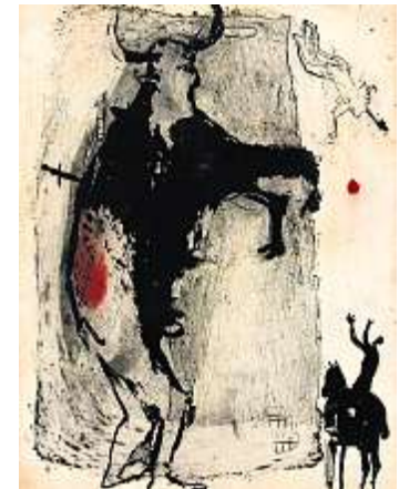
Patrick Loste, Don Quichotte, Aquatinta, 2007

Maler, Bildhauer und Aktionskünstler. Die Ausstellung vereint daher ganz unterschiedliche Temperamente, Handschriften, Stile und Themen. Expressiv gezeichnete Köpfe, fantasievolle Fabelwesen und witzig-surrile Tierporträts, unberührte Natur und zergliederte Landschaften sind ebenso vertreten wie surreal anmutende Stilleben oder abstrakte, konstruktive Farbfelder und gestische Linienbündel des Informel.