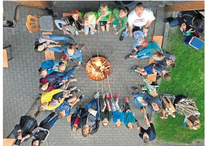
Die Kinder und Betreuer der FWV-Jugendgruppe hatten viel Spaß beim Stockbrotgrillen.

Auch in diesem Jahr trafen sich wieder über 20 Kinder zum Jugendwochenende der Frankenwaldverein-Ortsgruppe Lippertsgrün im Gerlaser Forsthaus. Unter dem Motto „Einmal Milchstraße und zurück“ entdeckte man gemeinsam das Weltall. Am Samstag hatte sich dazu ein Besuch von der Sternwarte in Hof angekündigt. Hier erfuhren die Kinder die Lage mancher Planeten und konnten selbst bekannte Sternbilder entdecken. Natürlich kamen auch Spiel und Spaß an diesem Abenteuerwochenende nicht zu kurz. Auch der Planetenweg in Bobengrün wurde gemeinsam mit Erwachsenen Begleitern abgelaufen.