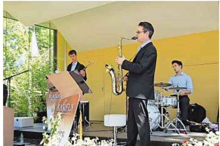
Barfly sorgen am Sonntag für Stimmung.