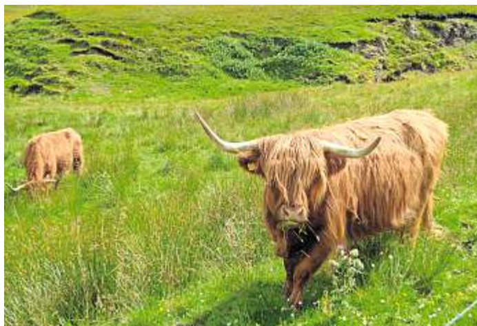
Galloway-Rinder sind, neben anderen Arten, die Landschaftspfleger in der Thüringeti.

Die gesamte Fläche wird durch extensive Beweidung bewirtschaftet und bildet eine Oase für Pflanzen, Tiere und Insekten. Steht man inmitten weidender Großtiere, wie Galloway, Highland oder Heckrindern, eine Rückzucht des Auerochsen, fühlt man sich wie auf einer Safari. Die man im Übrigen dort auch buchen kann. In Kleingruppen oder auch im Großraumbus. Die Thüringeti - ein Vorzeigeprojekt in puncto Tierwohl, Landschafts-