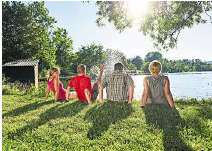
Exzellente Wasserqualität kann auch der Freizeitsee Lichtenberg nachweisen.

Kronach/Lichtenberg - Gemäß dem leicht abgewandelten 60er-Jahre-Schlager „Pack die Badehose ein, nimm dein kleines Schwesterlein und dann nichts wie raus“... – ...zu den Frankenwald-Seen und -Naturfreibädern kommen die Badenixen und Freibadliebhaber an heißen Tagen hervor: Gewappnet mit Handtüchern, Badelatschen, Sonnencreme und Picknick-Körbchen pilgern Sonnenhungrige zu den zahlreichen kühlen Gewässern.