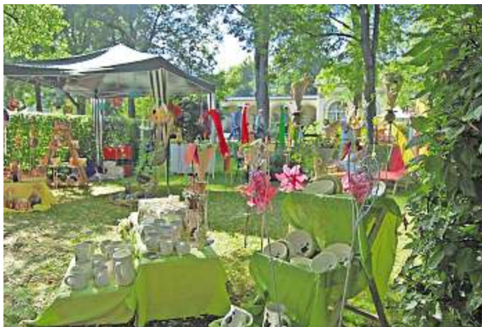
Ein Kunst- und Handwerkermarkt vor dem Klenzebau lädt zum Einkaufsbummel ein.

Ihre Wünsche dürfen die kleinen und großen Besucher außerdem am Stand der AOK Hof an Luftballons heften und in die Luft schicken. Oder sie lassen sich mit ein paar Drehs aus einem Luftballon durch ein paar geschickte Drehungen einen lustigen Pudel, ein tolles Schwert für mutige Ritter oder eine zarte Feder für kleine Indianerinnen zaubern. Immer mit dabei: Jolinchen, das lustige Maskottchen der AOK. Der kleine grüne Drache tanzt und bastelt mit den Kindern oder übt mit den jüngsten Besuchern im Mitmach-Zirkus die ersten akrobatischen Kunststücke.