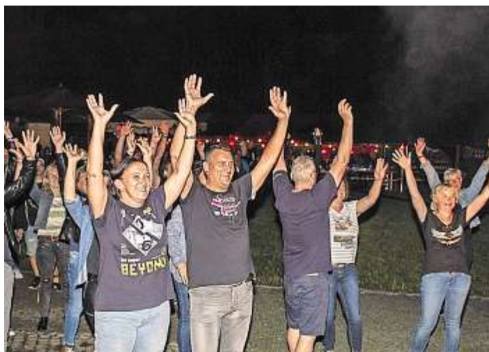
Zu den Klängen von Granny's Pearl tanzten die Gäste vor dem Musikpavillon in der Marlesreuther Freizeitanlage.