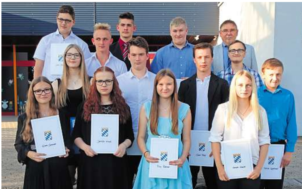
Abschlussfeier der 9. Klasse: Die Schüler der neunten Klasse und ihr Lehrer haben das Ziel erreicht.