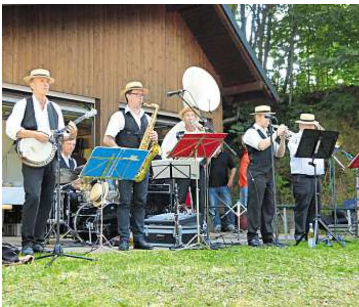
Spielt beim diesjährigen Jazz-Frühschoppen des TCS Selbitz am 12. August auf: Die Dixieland-Six Jazzband.

Wer die Band schon erlebt hat, weiß genau das beherrschen die sechs Musiker geradezu perfekt. Auf das Mittagessen zu Hause können die Besucher guten Gewissens verzichten, denn das eingespielte TCS-Team wird wieder für ein auswahlreiches Angebot an Speisen und Getränken sorgen, die selbstverständlich an den Tischen serviert werden. Der Eintritt zum Jazzfrühschoppen ist frei, er findet bei jedem Wetter statt, ausreichend Parkplätze stehen am ehemaligen Selbitzer Hallenbad zur Verfügung.