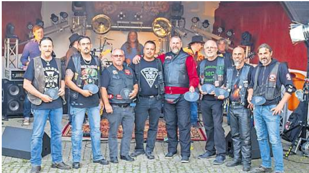
Die Black Chicken bedankten sich mit einer Schiefertafel bei ihren Bikerfreunden.

Marlesreuth - 1988 gründeten 15 befreundete, freie Biker, die schon immer gern zu Motorradtreffen führen, den „MC Black Chicken“. Der Name „Black Chicken“ entstand deshalb, weil alle Gründungsmitglieder aus Marlesreuth kamen. Die Marlesreuther werden in unserer Gegend die „Buddla“ (Hühner) genannt, deshalb kamen die Gründer auf den Namen „Chicken“. Aus der nachfolgenden Diskussion ergab sich dann schließlich der Name „Black Chicken“. Am vergangenen Wochenende stand die Jubiläumsparty zum 30-jährigen Bestehen des Motorradclubs an. Und wenn die Black Chicken feiern, dann feiern sie richtig. Von Freitag bis Sonntag fand in der Freizeitanlage in Marlesreuth eine Riesenparty statt. Die Fattigauer Schlossbrauerei hatte extra ein spezielles Bier für die Motorradfreunde eingebracht. Am Freitag spielten die beiden Bands Flatman und die Steve Morgen Band auf. Flatman legte mit Southernrock im Stil von Lynyrd Skynyrd eine tolle Performance an den Tag. Das Publikum tobte. Als Drummer Michael Schneiderbanger mit seinen Sticks ein „T“ zum Song „T for Texas“ von Lynyrd Skynyrd stilisierte, bekam er stehende Ovationen von den Gästen. Später am Abend legte dann die Steve Morgen Band nach. Mit et-