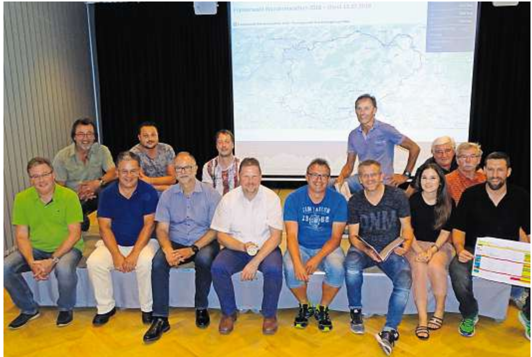
Besprechungen der Details an den Stationen für den Frankenwald Wandermarathons mit den Organisatoren.

An der Göbelhalle in Helmbrechts erfolgt nach einem Frühstücksbuffet der gemeinsame Start um 7 Uhr. Erfrischungen gibt es an vielen Stationen, doch wie wäre es mit Stimmung an der Ort Alm, Laserbiathlon in Gösmes Walberngrün oder einem Kärwaschnaps in Enchenreuth? Treppe der Verdammnis werden die 650 Stufen zum Burgstall Radeck genannt, eine Moun-