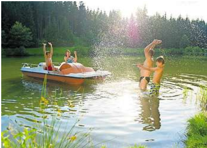
Badespaß am Ölschnittsee bei Steinbach a.Wald.