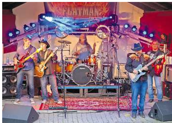
Flatman legte mit Southernrock im Stil von Lynyrd Skynyrd eine tolle Performance an den Tag.