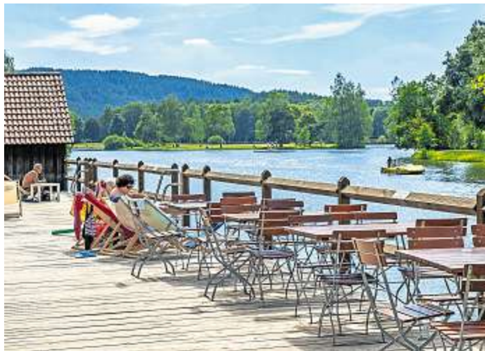
Planschen und erholen an heißen Sommertagen: Idylle am Trebgaster Badensee.

Und hier kann man sich wunderbar in der sommerlichen Hitze bei exzellent gemäß EU-Richtlinien nachgewiesenen Wasserqualitäten erfrischen. Wer nach dem kühlen Nass etwas Sonne tanken oder unter schattenspendenden Bäumen entspannen will, der kann das auf den ausreichend vorhandenen Wiesenflächen tun. Darüber hinaus gibt es an fast al-