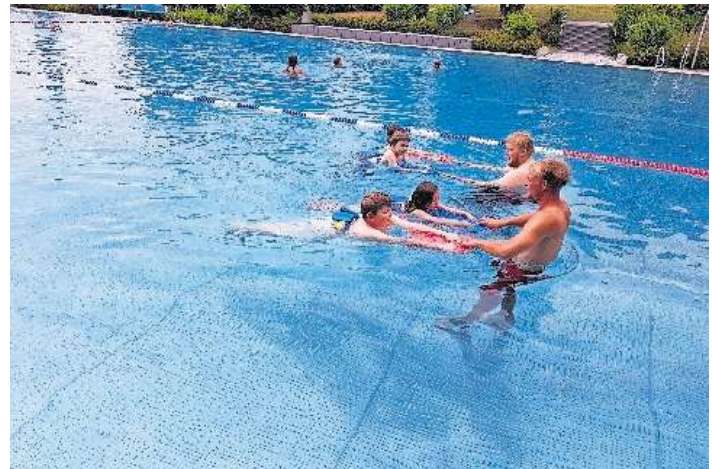
Eine Woche Schwimmkurs in Schleiz absolvierten die Kinder des Gruppenhauses 6, um die verschiedenen Abzeichen zu erhalten.

Nach dem täglichen Schwimmkurs hatten die Kinder noch Zeit zum Schwimmen, Toben, Rutschen und Spielen. Ein besonderes Highlight für die Kinder war die große Rutsche des Freibads, welche durchgängig von den Kindern genutzt wurde.