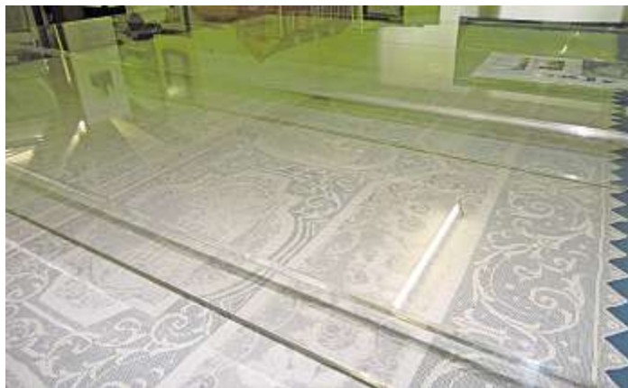
Das Tafeltuch ist eines von drei Objekten, das die Stadt Naila eingereicht hatte.