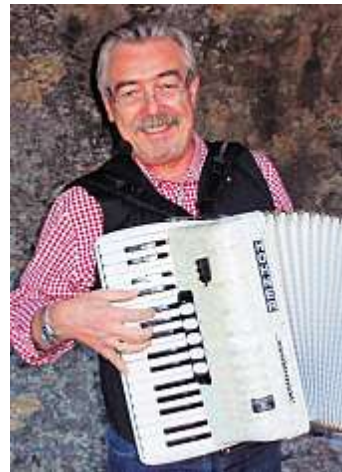
Der Gerch (links) und der Frankensima gehen gemeinsam auf Tournee.

wurden bisher veröffentlicht. Die „Hofer Spaziergänge“ sind die älteste Dialekt-Glosse in bayerischen Zeitungen. Bei besonderen Anlässen liest Böhm die „Gerch-Erlebnisse“ auch selber vor: Geschichten voller Mutter-