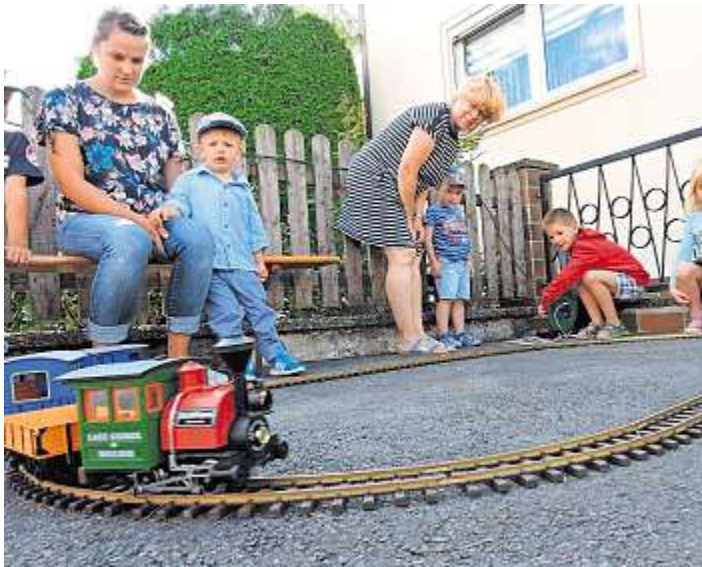
Hier dürfen kleine Besucher Lokführer spielen.