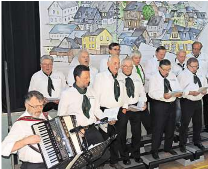
Das Foto zeigt die Adelberg-Boum bei einem ihrer zahlreichen Auftritte in der TSV-Turnhalle in Carlsgrün.