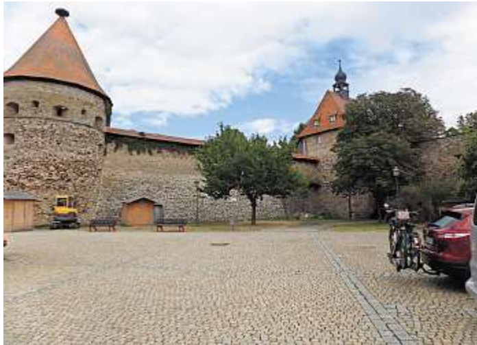
Die Burg Hohenberg, 125 Meter über der Eger, ist die am besten erhaltene Buranlage im Fichtelgebirge.

Die Mitglieder des Vereins wurden von zwei fachkundigen Führerinnen durch die deutsche Porzellan Geschichte vom beginnenden 18. Jahrhundert bis zur politischen Wende 1989 geführt. Zu sehen ist im Museum eine fantastische Schau mit sowohl alltäglichem einfachen Gebrauchsgeschirr, Hotel- und