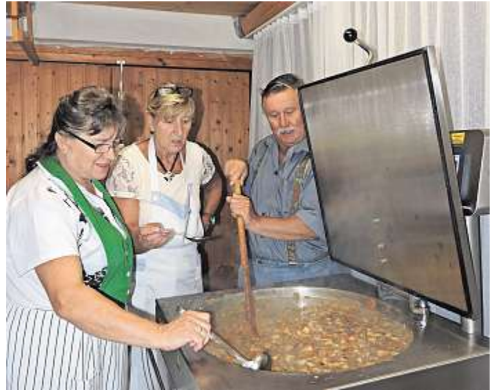
Letzte Vorbereitungen für den beliebten Schwamma-Schnitz

gehackter Petersilie und auf Wunsch mit einer Scheibe Brot, eine lange Schlange bilden. Denn viele der Gäste kommen extra auf Schusters Rappen, mit dem Radel oder per vierrädrigen Untersatz, nur um diesen leckeren Schnitz genießen zu können. Dafür braucht es Vorarbeit und bereits am Samstag wird das „Gemüse geputzt“ und ab Sonntagfrüh stehen dann die Köche am großen Kessel, um die leckeren und heiß begehrten circa 150 Liter Schwamma-Schnitz zuzubereiten. Die Mitglieder der