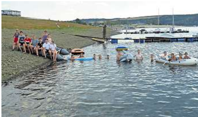
Viel Spaß hatten die Wasserwachtler im Wasser

Schwarzenbach a.Wald - Das Wetter meinte es mehr wie gut mit den Wasserwachtlern der Ortsgruppe Schwarzenbach am Wald beim traditionellen Zeltlager auf dem Campingplatz Kloster, nahe Saalburg. Kinder, Jugendliche und Betreuer verbrachten erstmals fünf Tage, statt wie bisher nur einem verlängerten Wochenende, und kamen ganz ohne Fernseher, iPhone und Computer aus, aber dafür im und am Hauptelement Wasser. Auch an der Bleilochtalsperre hatte sich die lang anhaltende Trockenheit bemerkbar gemacht, der Wasserstand war wesentlich niedriger wie in den Vorjahren, was aber keinen Abbruch beim Treiben und Üben im Wasser tat. Nach dem Zeltaufbau gemeinsam mit Eltern und Geschwistern standen Grillen und Familienabend auf dem