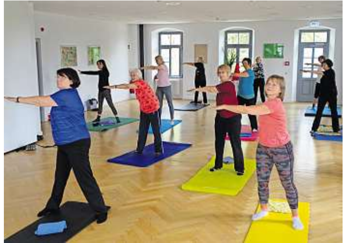
Einer der beliebtesten Kurse ist Pilates.

Anmeldeschluss eine Woche vor Kursbeginn unter vhs@schwarzenbach-wald.de oder 09289-5043.