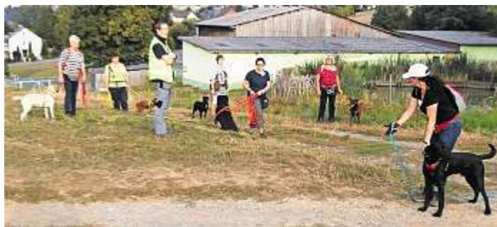
Das Foto zeigt die gemeinsame Diskussion der Ermittlungsergebnisse.

feinen Nasen an Weggabelungen zu entscheiden, in welcher Richtung weitere Hinweise zu dem Fall zu finden waren. Durch diese vielen im Wald und auf den Wiesenflächen versteckten Informationen, die zumeist die