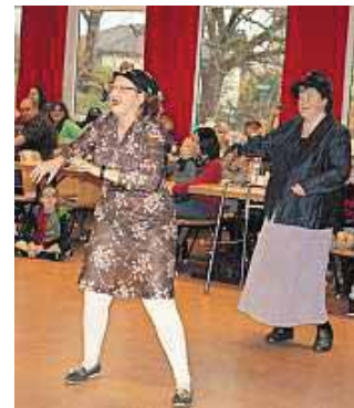
Die Red Ladys zeigten zur Sessionseröffnung einen Schautanz.

sauber gehalten werden, wenn der Bürgermeister „seinen Urlaub“ bis Aschermittwoch antritt. Zusätzlich erwartet die Präsidentin der Karnevalsabteilung,