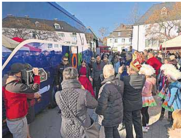
Das Prinzenpaar (Bildmitte) verlässt den Privat-Bus und schreitet zur Inthronisation.

einige der Zuschauer bereits ein Folge-Prinzenpaar, welches weit und breit nicht in Sicht war. Zur Überraschung aller öffnete sich plötzlich die von der Feuerwehr errichtete Straßensperre und ein 50-Sitzer-Reisebus fuhr vor das Rathaus. Zunächst stie-