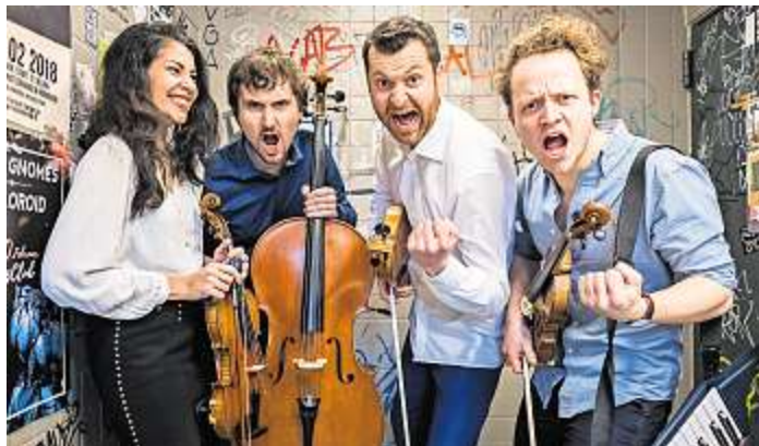
Das Feuerbach Quartett kommt im Februar.