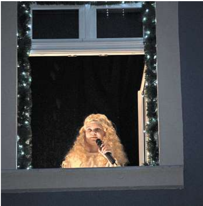
Auch das Christkind schaut in diesem Jahr wieder vorbei.