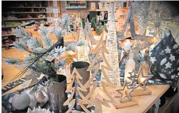
Mit der richtigen Deko wird's zu Hause so richtig weihnachtlich.

ten nicht mit erlesenen Lauensteiner Pralinen verwöhnen? Bei Feinkost Ernst sind die beim Advents-Shopping um zehn Prozent verbilligt.