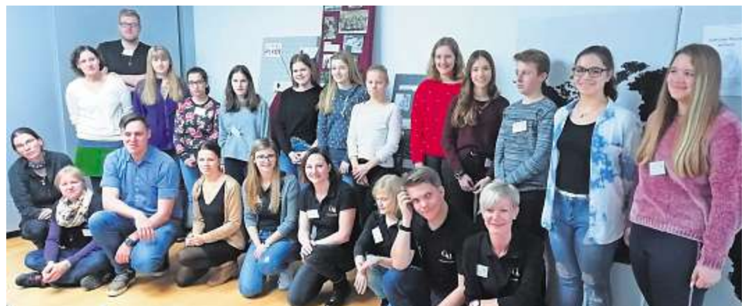
Die Teilnehmerinnen und Teilnehmer am Schnuppertag mit ihren Betreuern.

Die Organisatoren hoffen, die Ausbildung durch die Informationen beim Schnuppertag erleichtert zu haben.