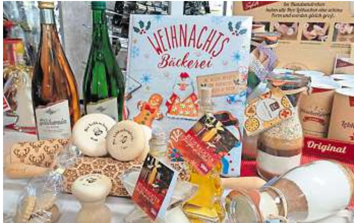
Geschenkideen in Verbindung mit Glühwein oder Lebkuchen gibt es beim Advents-Shopping.

Bad Steben – Die Vorweihnachtszeit bietet jede Menge Zeit für besinnliche und fröhliche Momente mit Freunden und Familie. Der Besuch eines oder gar mehrerer Weihnachtsmärkte, Glühwein oder Stollen lassen vorweihnachtliche Stimmung aufkommen. Und kann man dies alles mit dem Geschenkekauf verbinden, steht einem entspannten Fest nichts mehr im Weg. Aus diesem Grund haben sich die Bad Stebener Geschäftsleute zusammengetan, um am 7. Dezember länger offen zu halten – und die Kunden mit Weihnachtsatmosphäre und Rabattaktionen zu überraschen. Ins Leben gerufen hat die Aktion das Kaufhaus Philipp Horn . „Da es heuer keinen Weihnachtsmarkt gibt, kam uns die Idee mit