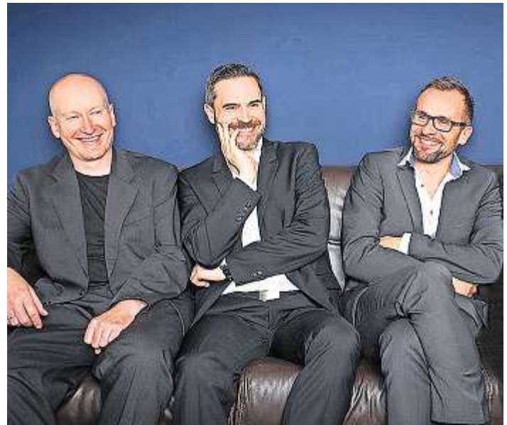
Barfly, das sind sanfte Klänge zum Mitswingen und Entspannen.