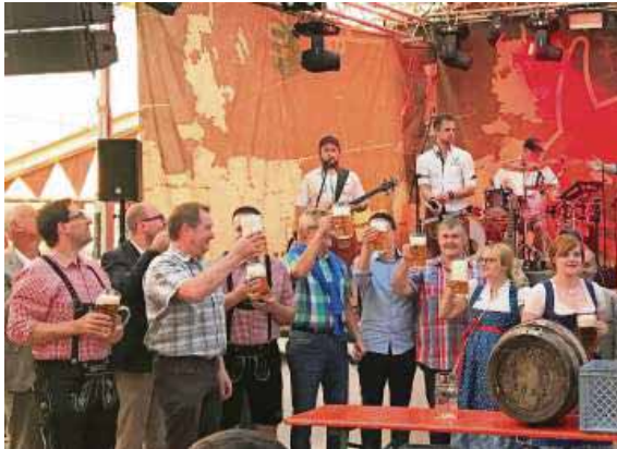
O'zapft ist - heißt auch heuer wieder beim 154. Heimat- und Wiesenfest

Eine Besonderheit ist außerdem, dass die Flaschen sogar mit dem Wiesenfestmotiv versehen sind und ein besonders individuelles Schmuckstück darstellen. Die Verkaufsfahrt führt wieder durch alle Ortsteile und