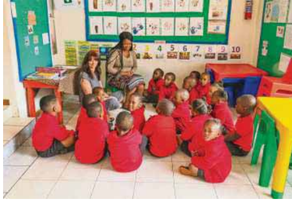
Die Kinder bekommen in der Vorschule „Wings of Hope“ alles, was ein Kind für die vorschulische Entwicklung und Bildung benötigt.