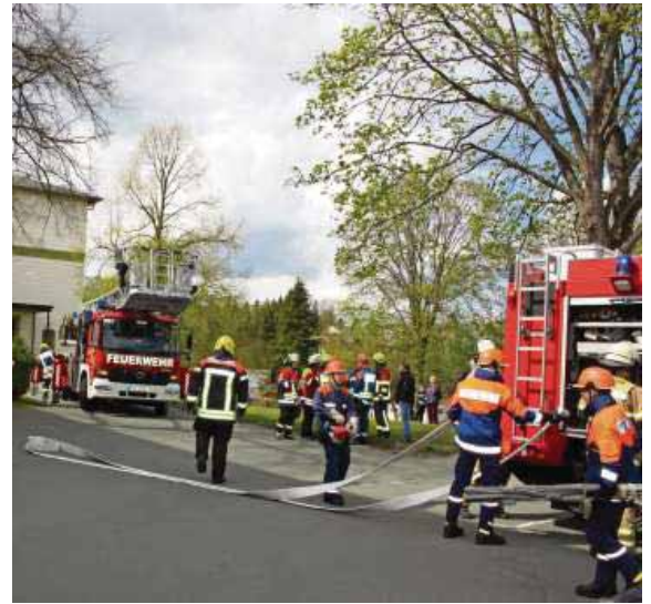
Großübung zum Berufsfeuerwehrtag der Jugend an der Evangelischen Schule in Naila mit 120 jugendlichen Feuerwehr-Einsatzkräften und den Einsatzfahrzeugen der beteiligten Wehren, unter der Einsatzleitung von Bastian Häßler.

Naila - Seit 20 Jahren wird in der Region ein Berufsfeuerwehrtag veranstaltet. Dieser dient dazu, dass junge Feuerwehrmänner und Frauen den Alltag einer Berufsfeuerwehr kennenlernen. Daneben soll aber auch die Kameradschaft der Jugendlichen im Alter von 12 bis 18 Jahren gepflegt und die Zusammenarbeit geprobt werden, um für einen