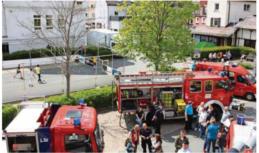
Die Freiwillige Feuerwehr war auch beim Nailaer Frühling mit dabei.

Mit einem großen Programm feiert die Freiwillige Feuerwehr Naila ihr 150-jähriges Jubiläum.