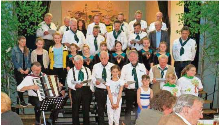
Das zehnjährige Bestehen der Gesangsgruppe AdelbergBoum feierte man mit einem „CaesarianenDouch“ in der TSV Turnhalle, garniert mit turnerischen und tänzerischen Darbietungen sowie einem gemeinsamen Wertshausingen.