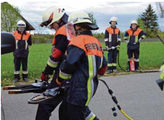
Üben für den Ernstfall: Zwei Gruppen der Feuerwehr legten die Leistungsprüfung THL erfolgreich ab.