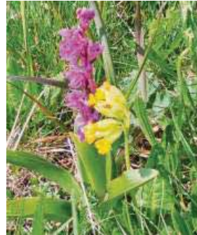
Stattliches Knabenkraut am Hagenbühl.