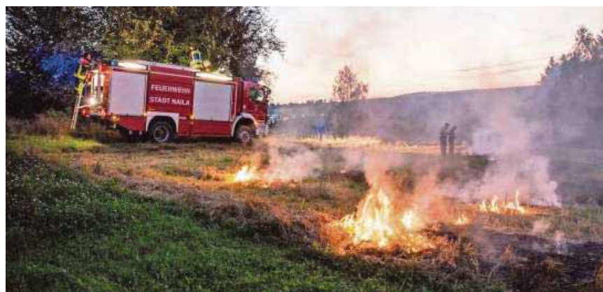
Bekämpfung eines Brandes beim Kinderheim Martinsberg, der im September 2016 auf einem Stoppfeld in der Nähe ausgebrochen war.

2019 In diesem Jahr wird uns der neue Rüstwagen übergeben.