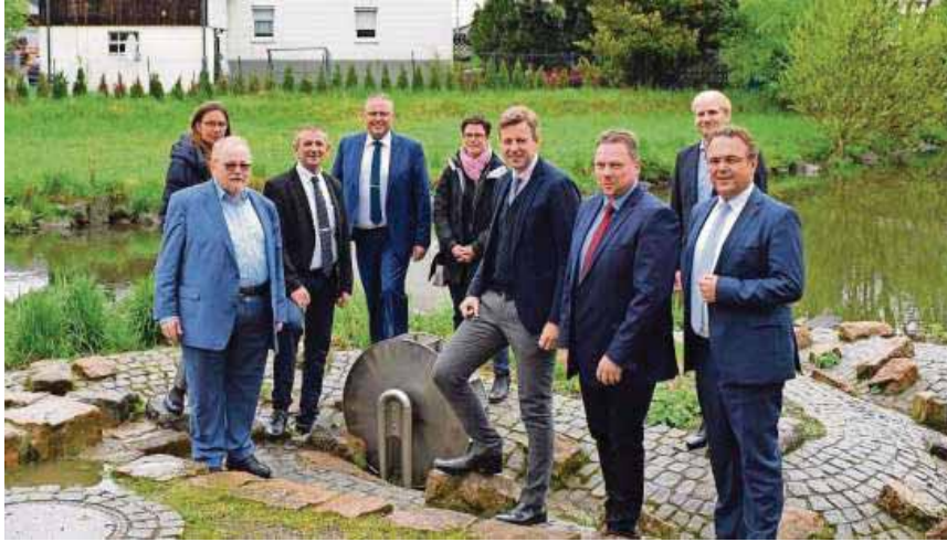
Besichtigung des Wasserspielplatzes am Anger in Selbitz mit den Bürgermeistern aus SSN+ und den Ehrengästen.

Selbitz - Der Tag der Städtebauförderung findet jährlich in der ganzen Bundesrepublik statt. Ziel ist es, die Erfolge der Stadtentwicklung sichtbar zu machen und zu feiern. Dieses Jahr wurde in Selbitz - nach erfolgreicher Umgestaltung - der Anger als neuer Lebensmittelpunkt von Selbitz eröffnet. Am Samstag, den 11. Mai, fand eine Einweihungsfeier im angrenzenden Veranstaltungsraum in der Kulmbacher Straße 2 statt. Auch dieses Gebäude wurde im Zuge der Aufwertungsarbeiten saniert und im Erdgeschoss öffentliche Toiletten sowie ein Raum für Veranstaltungen geschaffen. Am Tag der Städtebauförderung war dieser mit über 60 Bürgerinnen und Bürgern sowie geladenen Ehrengästen gut gefüllt. Neben einer Ausstellung zur Stadtentwicklung in der Zukunftsallianz SSN+ war der Gemeinschaftsraum an diesem regnerischen Tag idealer Raum für die Reden, Glückwünsche und den Segen für die offizielle Eröffnung des