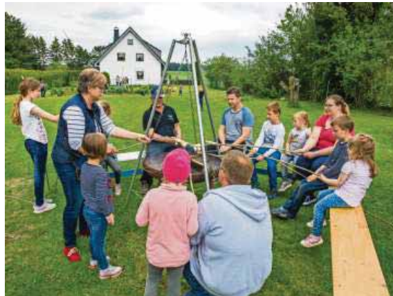
Nach getaner Arbeit durften sich die Kinder an der Feuerschale Stockbrote oder Würstchen grillen.