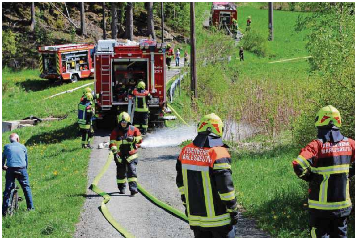
Die Feuerwehrkameraden beim Einsatz im Tannenreuthgrund.

Beim Fest am Abend spielte die Gruppe „Horch a Moll“, in der gut gefüllten Turnhalle auf.