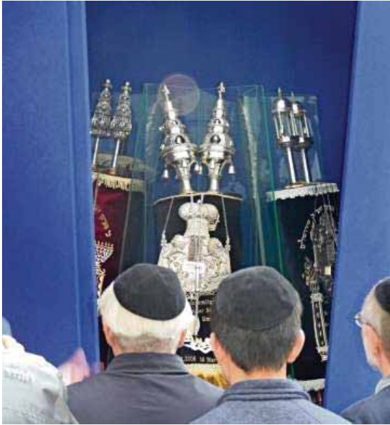
Auf dem Foto sind einige Männer der Marxgrüner Reisegesellschaft mit Kippas vor dem Schrein mit den Thora-Rollen in der jüdischen Synagoge in Chemnitz zu sehen.