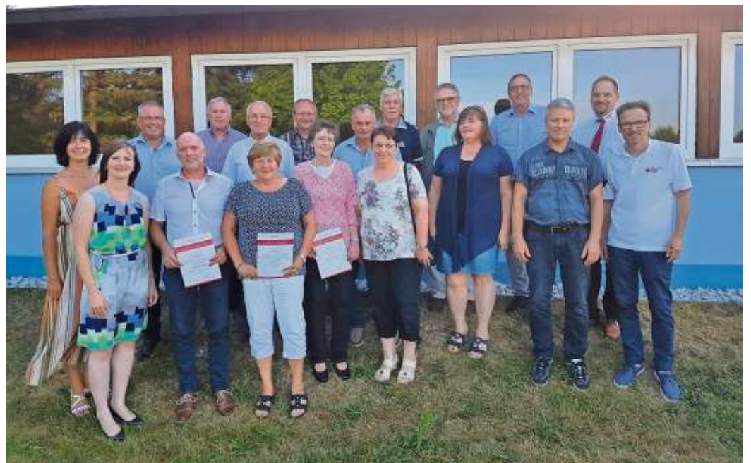
Die Geehrten für 100-, 125- und 150-malige Blutspende.

Bei der Ehrung überreichte Eberl allen Geehrten die Urkunden, Ehrennadeln und Geschenke des Blutspendedienstes (BSD).