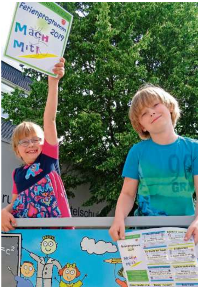
Bei so vielen Angeboten kommt bestimmt keine Langeweile auf!

Schwarzenbach a.Wald – Anmeldung muss sein und zwar „Mach mit“ heißt es gerade für viele Jungen und Mädchen beim Ferienprogramm der Stadt Schwarzenbach a.Wald. einige Angebote wie Wasserspaß, Biblisch kochen, Geheimnisse des Weltalls oder Aktionen bei der Bergwacht haben die Kids schon hinter sich. Die insgesamt 20 Veranstaltungen sind teilweise ausgebucht oder noch wenige Plätze frei. Da freuen sich natürlich die Vereine, die in Zusammenarbeit mit der Stadt ein tolles Programm anbieten. Anmeldung muss sein und zwar unter 09289-5043 oder christine.rittweg@schwarzenbach-wald.de. Für die Kinder gibt es auch immer eine kleine Verköstigung. INFO Weitere Infos unter www.schwarzenbach-wald.de oder auf Facebook Schwarzenbach a.Wald. Bei Lamawanderung, Fahrt zum Zoo Leipzig, Schnitzeljagd und Besuch Bauernhof sind nur noch einzelne Plätze frei.