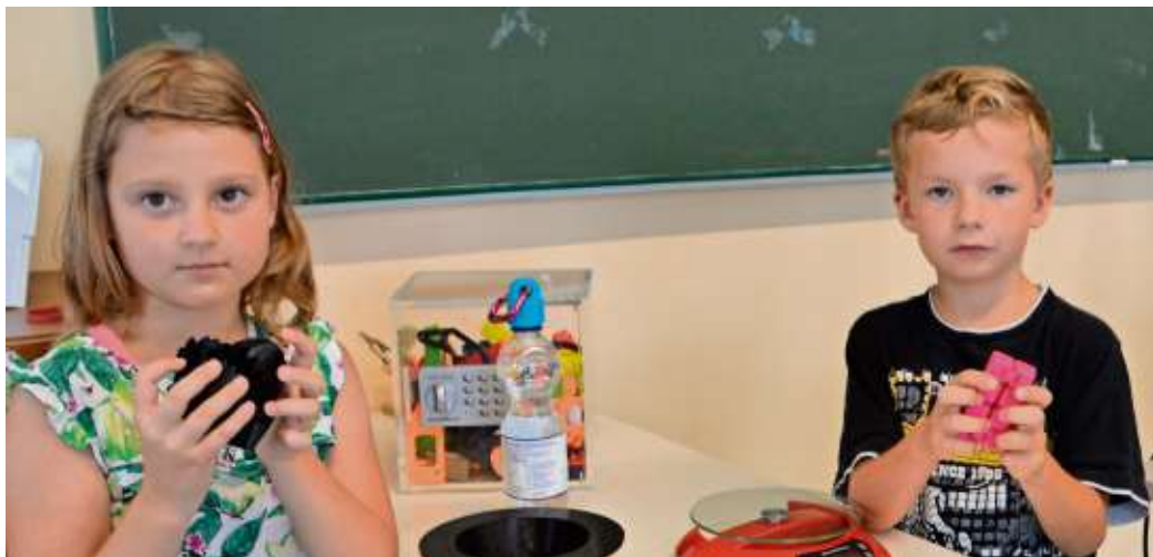
Zauberwürfel und Zauberherz können gedruckt werden.