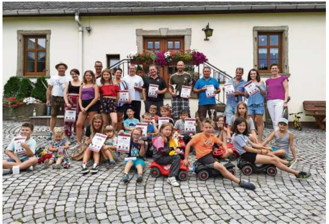
Das Bild zeigt die Teilnehmer und Gewinner des diesjährigen Bobbycar Rennens.