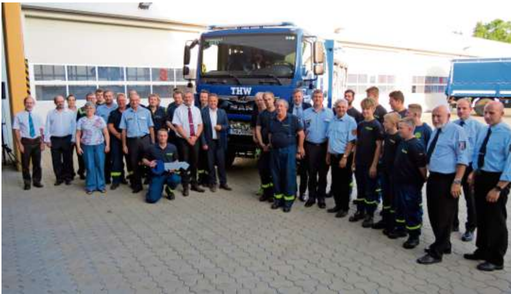
Der Gerätekraftwagen war einer der zwei neuen Einsatzfahrzeuge des Ortsverbandes des Technischen Hilfswerks Naila, das offiziell in den Dienst gestellt worden ist. Die Ehrengäste und THW-ler stellten sich für ein Erinnerungsfoto auf.