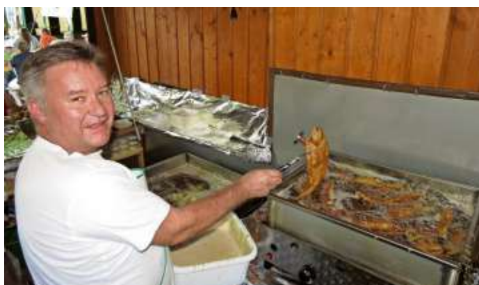
In der Küche ging es an der Fritteuse hoch her.