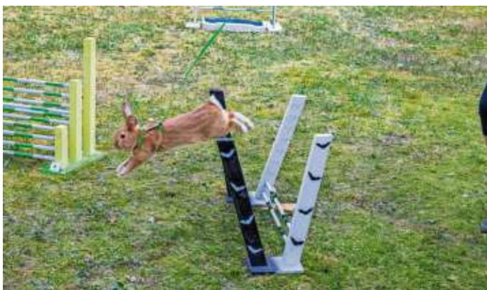
Gekonnt und elegant übersprangen die Kaninchen die Hindernisse.

Der Kleintierzuchtverein B980 Marlesreuth feierte am vergangenen Wochenende sein zweitägiges Sommerfest am Wanderheim des FWV Marlesreuth. In diesem Jahr hatten sich die Marlesreuther eine besondere Attraktion ausgedacht: ein Kanin-Hop-Turnier. Dabei müssen die Kaninchen einen ähnlichen Sprungparkour bewältigen, wie die Pferde, nur sind bei den Kaninchen die Hindernisse ein paar Nummern kleiner. Am Sonntag gab es dann noch ein beeindruckendes Hoch- und Weitsprungturnier. Hier liegt der Rekord in Deutschland bei einer Höhe von 90 Zentimetern und einer Weite von 2,37 Metern. 1. Bürger-