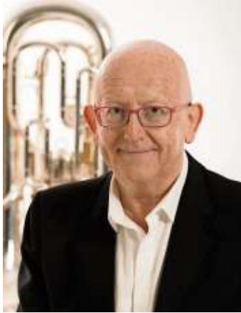
Der bekannte Euphonium-Solist ist der Stargast.

Lichtenberg - Brass vom Feins- ten erwartet die Besucher beim Haus Marteau auf Reisen-Konzert am kommenden Samstag, 3. August an einem ganz un- gewöhnlichen Ort: Der Ensemble- kurs für Blechbläser tritt zusam- men mit der Formation Rekkenze Brass und dem diesjährigen Stargast Steven Mead mit sei- nem Euphonium im Liros-Garn- lager in Lichtenberg auf. Beginn des Konzerts ist um 19 Uhr. Wer Rekkenze Brass kennt, weiß, wie beschwingt die Kon- zerte der Hofer Blechbläserfor- mation sind. Im Garnlager der Firma Liros treten sie zusammen mit Steven Mead, einem der be- kanntesten Euphonium-Solis- ten, und dem Ensemblekurs für Blechbläser der Internationalen Musikbegegnungsstätte Haus Marteau auf. Alle zusammen studieren aktuell ein anspruch- volles Konzertprogramm ein. Im Vordergrund steht dabei der Spaß am Musizieren mit dem Ziel, die Grenzen zwischen Amateuren, Studenten und Pro- fis aufzuheben. „Haus Marteau auf Reisen ver- spricht Musikgenuss an ganz außergewöhnlichen Orten. Wir freuen uns, auch in diesem Jahr