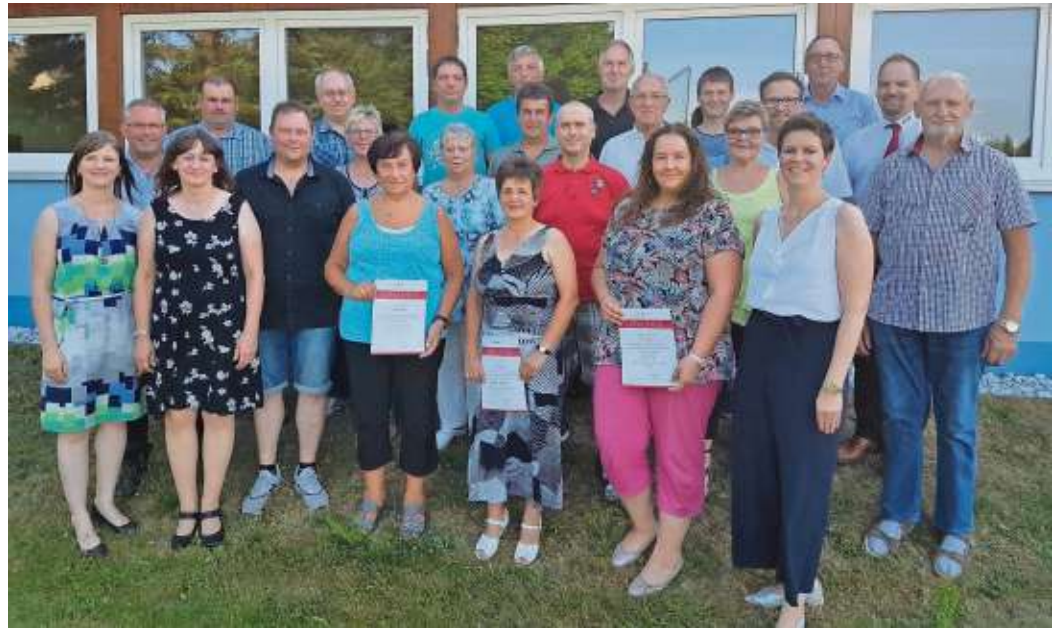
Die Geehrten für 50- und 75-malige Blutspende.

Anmeldung unter 09288/9259700 oder natur-kraeuter-klang.de