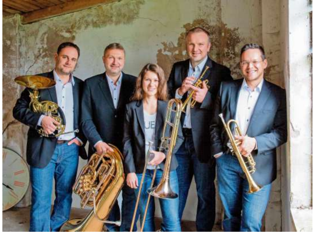
Am morgigen Samstag ist es so weit: Die Formation Rekkenze Brass tritt im Rahmen der Reihe Haus Marteau auf Reisen im Liros-Garnlager in Lichtenberg auf.