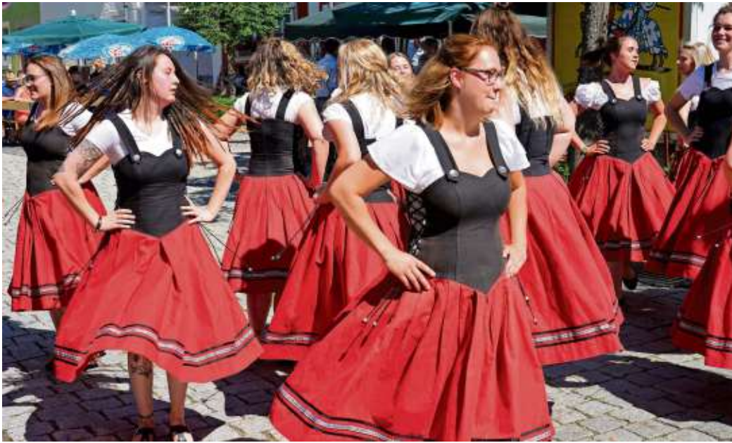
Die Lichtenberger Rotröcke in ihren traditionellen Kleidern: Hinter jedem einzelnen steckt höchste Präzision.