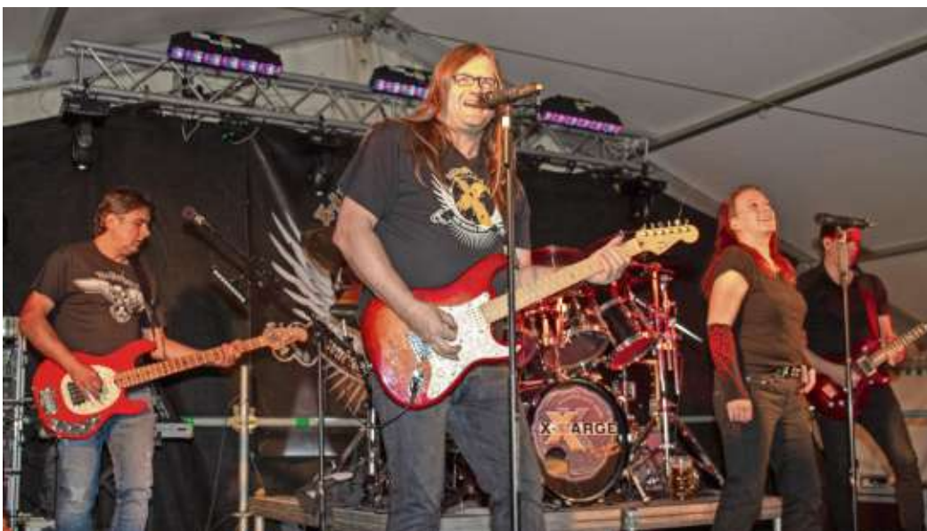
Die Hausband für das Bikertreffen „X-Large“ wird das Festzelt wieder zum Kochen bringen.

netten Menschen feiern wollen. Unter dem Link www.mrc-langenbach.de ist die Wegbeschreibung zum Clubhaus mit weiteren Infos zu finden.