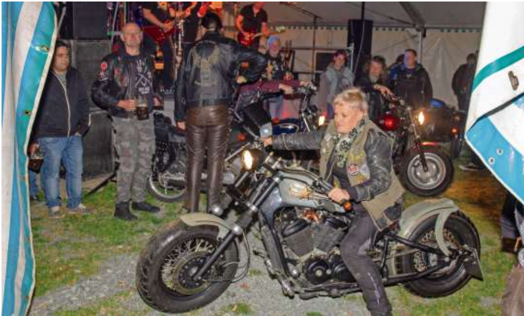
Im Festzelt werden auch regelmäßig die heißen Öfen zur Schau gestellt, was die Stimmung zusätzlich anheizt.