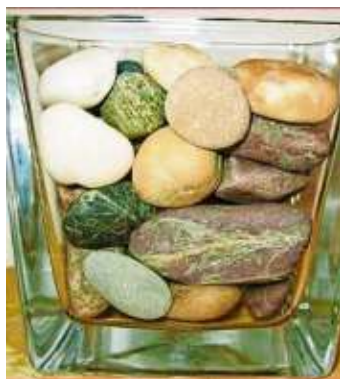
Große Steine verdeutlichen die wichtigen Dinge im Leben, dafür muss im Leben genügend Platz sein.

Füllt man ein Glas bis zum Rand mit großen Steinen, können noch Kieselsteine dazwischen rutschen, danach rieselt in die letzten Lücken auch noch Sand. Würde man ein Glas bis zum