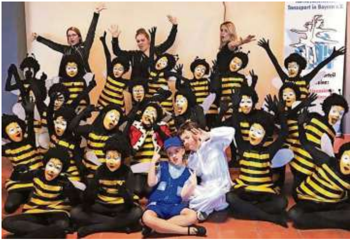
Vorbereitung auf die nächste närrische Session: Die Kartenvorverkauf beim TuS 02 Lippertsgrün startet bereits am kommenden Sonntag.