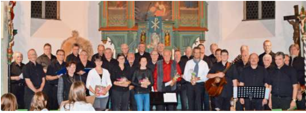
Der gastgebende Chor MGV 1876 Döbra mit Organisatoren und Teilnehmern.