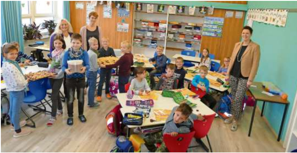
Die Viertklässler der Grundschule Berg bereiteten sich auf den Lesewettbewerb vor