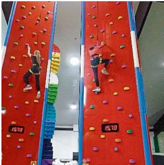
Zwei Schülerinnen der 7. Klasse im Wettkampf um die Bestzeit

und glücklich die Klettergurte wieder ab und nicht nur aus einem Mund war das Fazit zu hören: „Hier will ich meinen nächsten Geburtstag feiern!“