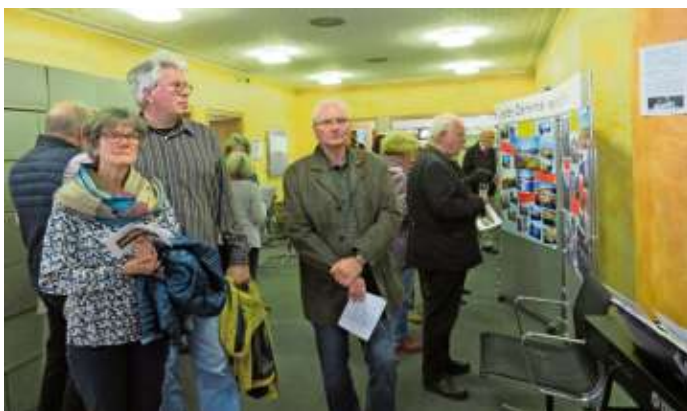
Viele Besucher kamen zur Eröffnung der Ausstellung in der Sparkasse.