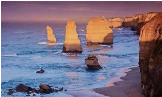
Die berühmte Felsformation der 12 Apostel.

Sydney – glitzernde Hochhäuser, malerische Buchten, das Sydney Opera House und die Harbour Bridge bei Nacht – eine Stadt, die man nicht so schnell vergisst. Eindrucksvolle Naturerlebnisse bieten die Blue Mountains, die Snowy Mountains, mit dem höchsten Berg Australiens, dem Mount Kosciuszko, die kargen Granithügel des Mount Buffalo Nationalparks und die wilden Gebirgszüge der Grampians. Der absolute Höhepunkt im Süden Australiens sind die wilden Küstenlandschaften des Port Campbell National-