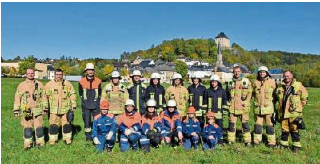
Das Projekt „Regenbogen 2000“, an dem sich die Feuerwehren Berg, Tiefengrün und Hirschberg beteiligten, soll an die offenen Grenzen erinnern.

Durch das Erzeugen einer Wasserkuppel mittels Strahlrohre soll so durch das Brechen des Sonnenlichtes ein Regenbogen entstehen. Der Regenbogen symbolisiert länderübergreifend die Verbundenheit und Freundschaft der Feuerwehren und erinnert in unserer Region an den