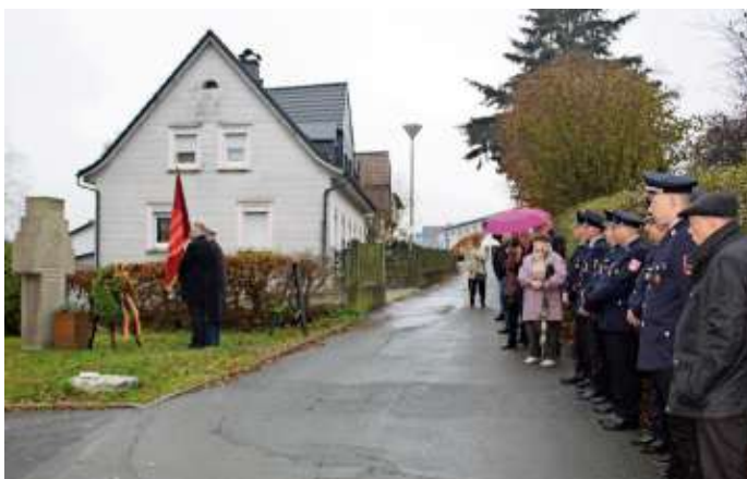
Das Foto zeigt die Kranzniederlegung am Friedhof in Lippertsgrün

Vergessenheit gerät, ist es notwendig, auch heute noch den Volkstrauertag zu begehen“, so Stumpf.