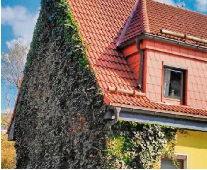
Efeu ist ein Luftakkumulator und in der Lage Benzol, Formaldehyd, Xylol und Toluole zu binden.

Nickelhaltiges Serpentinegestein, wie es rund um Wurlitz vorkommt und auch dort abgebaut wird, ist ein regionales Beispiel, schreibt die Ortsgruppe Frankenwald Ost des Bund Naturschutz in Bayern in einer Pressemitteilung. Auf der Woja-Leithe wachsen nur speziell angepasste und seltene Kräuter. In anderen Ländern wie in Albanien, sind die dortigen Serpentinböden besonders stark nickelhaltig. Kulturpflanzen anzubauen hat man hier schon längst aufgegeben. Hier gedeiht aber das Mauersteinkraut prächtig, mit leuchtend gelbem Blütenstand. Dieses bisher scheinbar unnütze Brachlandgewächs hat es im wahrsten Sinne in sich: Die Pflanze ist ein Hyper-Akkumulator (bedeutet: speichern, sammeln). Mauersteinkraut reichert das im Boden vorhandene Metall Nickel in seinen Blättern an, und zwar in erstaunlichen Mengen. So können hier bis zu 100 Kilo Nickel von nur einem Hektar „geerntet“ werden. In der Pflanze sind dies nur ein bis zwei Prozent. Nach der Verbrennung des getrockneten Krauts enthält die Asche bereits 20 Prozent Nickel. So viel, dass es sich gegenüber sonstigen Gewinnungsme-