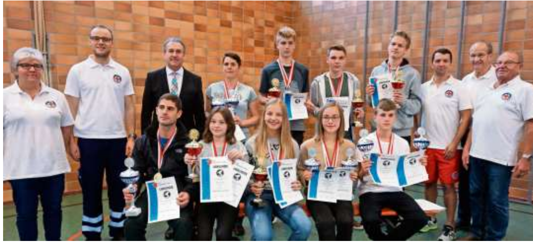
Das sind die Sieger der offenen Stadtmeisterschaft im Schwimmen.