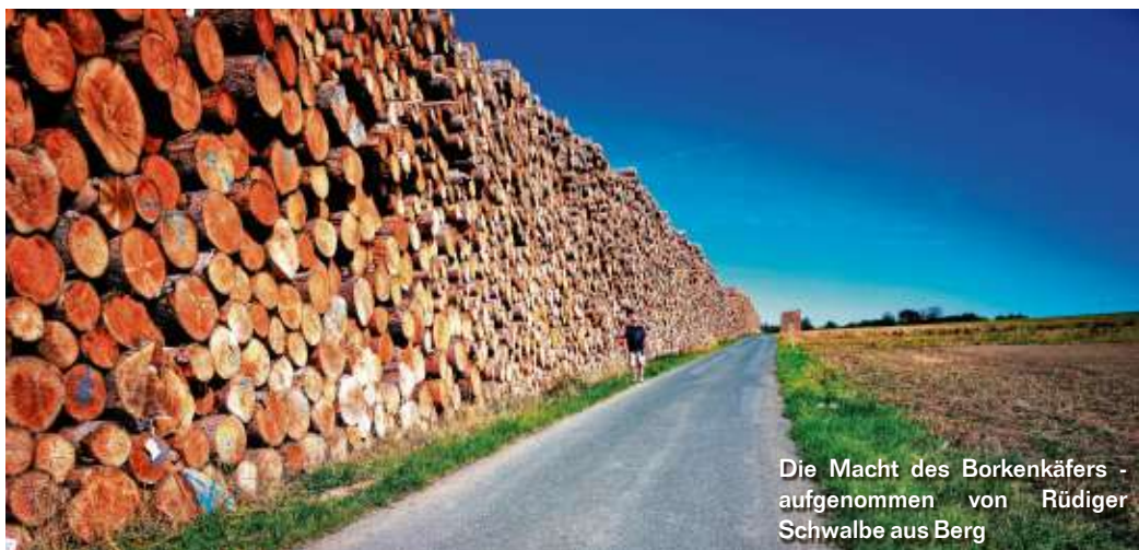
Die Macht des Borkenkäfers