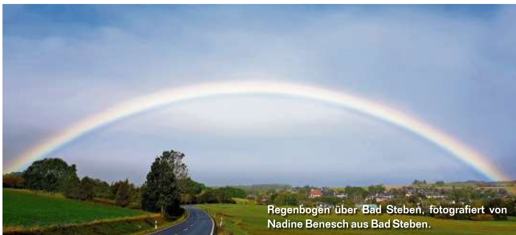
Regenbogen über Bad Steben.