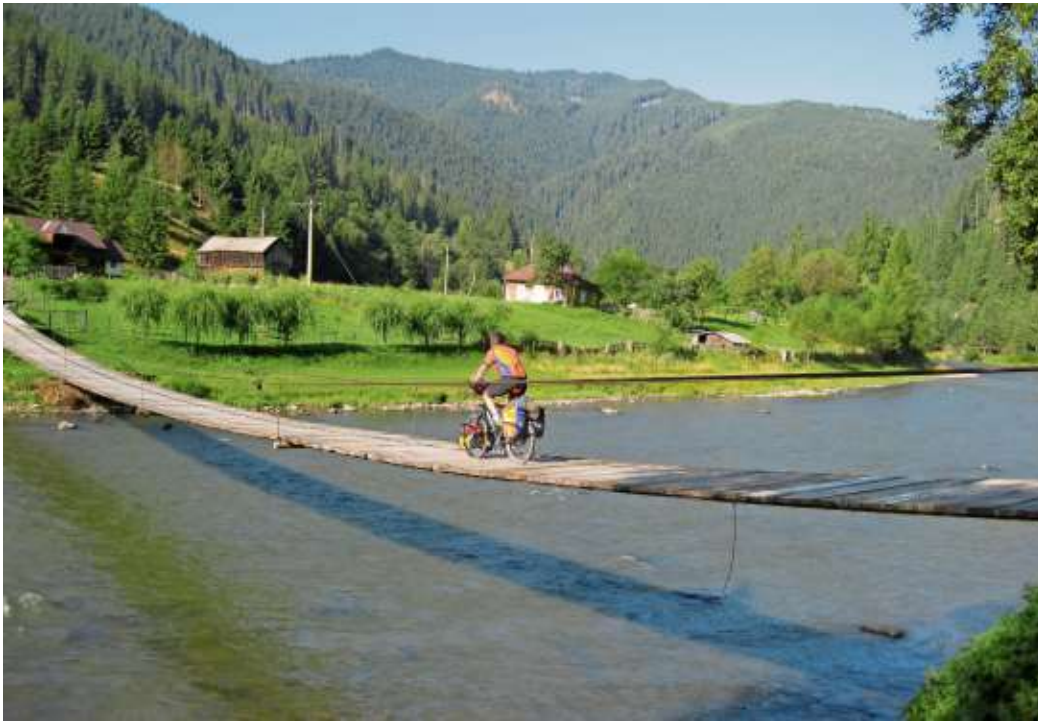
Mit dem Rad erlebt man diese fantastische Landschaft mit allen Sinnen.