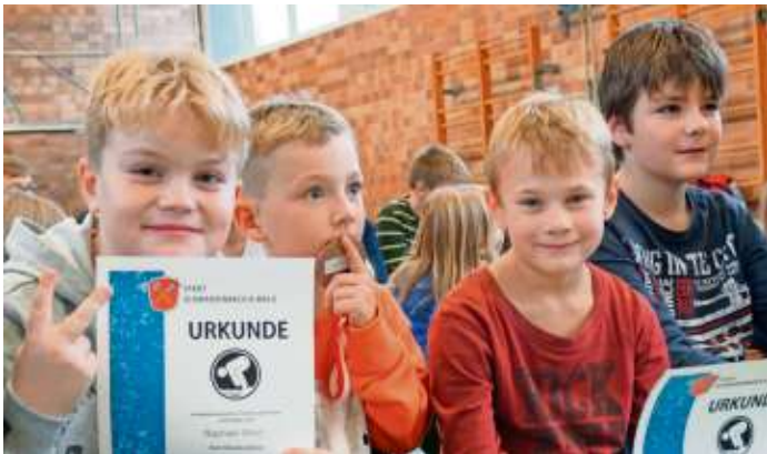
Die Kinder und Jugendlichen kämpften bei den 40. offenen Stadtmeisterschaften um Urkunden.

Die Klassenpreise für die Grund- und Mittelschule Schwarzenbach am Wald wurden nach Teilnehmerzahl prozentual vergeben. Hier siegte die Klasse 4a mit 44 Prozent. Die Schüler dürfen sich auf ein Essen mit dem Bürgermeister freuen. 43 Prozent erreichte die Klasse 3a und 35,1 Prozent die Klasse 2a. Sie erhalten einen Zuschuss für die Klassenkasse.