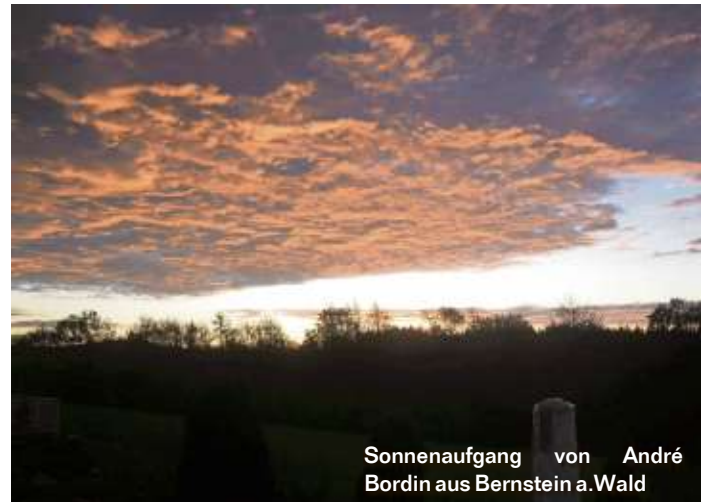
Sonnenaufgang von André Bordin aus Bernstein a. Wald