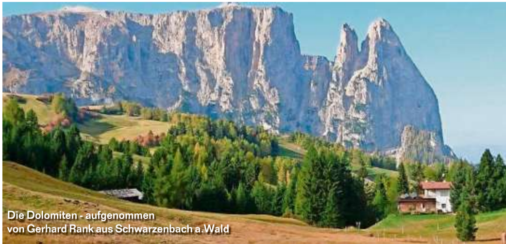
Die Dolomiten

Die WIR-Redaktion bedankt sich für die vielen beeindruckenden Bilder, die Sie uns an die E-Mail-Adresse redfrankenwald@kurier.de schicken. Auf dieser Seite präsentieren wir Ihnen einige Fotos, die bisher noch nicht veröffentlicht werden konnten.