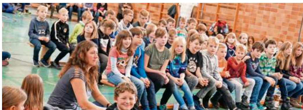
Nach dem Wettbewerb: Warten auf die Siegerehrung.