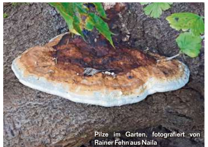
Pilze im Garten