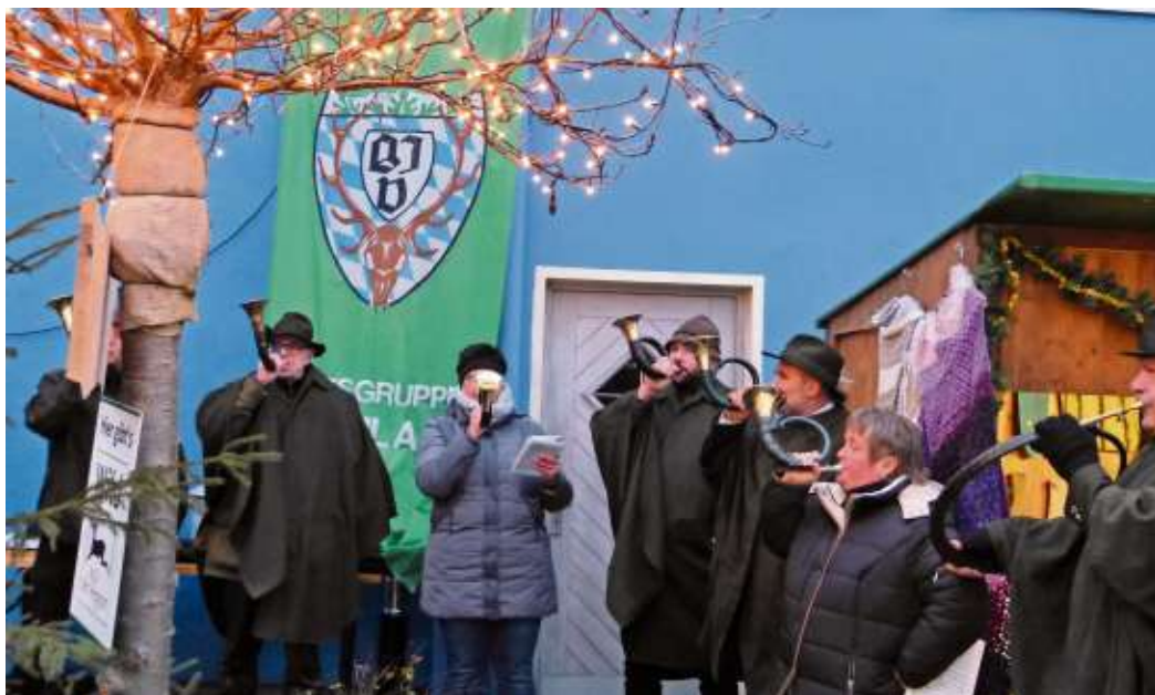
Nachdem das Christkind die Himmelstüre öffnet, spielt die Jagdhornbläsergruppe ein Ständchen.