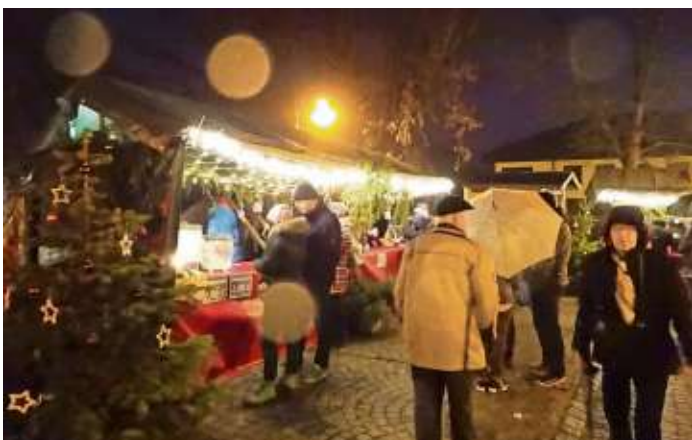
Der Gottesdienst in der Lutherkirche und der Stemmer Advent, die beide am kommenden ersten Advent stattfinden, sind zwei weitere Veranstaltungen der Vorweihnachtszeit.