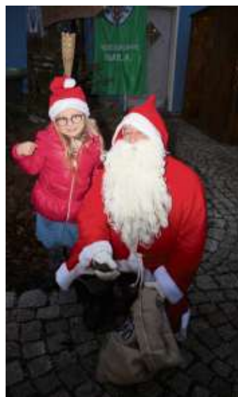
Auch der Nikolaus ist in diesem Jahr wieder mit dabei.

Hauptstraße 9 95119 Naila 09282/7524 leder-ziehr.de