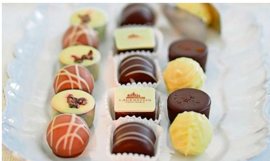
Auch die anderen am Advents-Shopping beteiligten Geschäfte überraschen ihre Besucher mit Rabatten - wie zum Beispiel Feinkost Ernst mit zehn Prozent Rabatt auf Lauensteiner Pralinen.