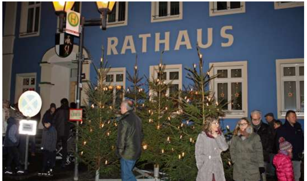
Vor der Stadtkirche und im Rathausinnenhof öffnet am Samstag der Rupperichmarkt seine Pforten.

Eine „lebendige“ Krippe wird vor der evangelischen Stadtkirche zu bestaunen sein und ab 15.00 Uhr stehen am unteren Marktplatz für Jung und Alt romantische Pferdekutschfahrten rund um das Marktgeschehen auf dem Programm.