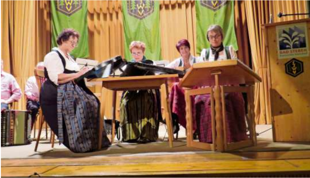
Der Kerzenabend am Vorabend des 1. Advents soll auf die bevorstehende Weihnachtszeit einstimmen.

Bad Steben - An diesem Wochenende stimmen gleich drei Veranstaltungen und ein besonderer Gottesdienst auf die bevorstehende Advents- und Weihnachtszeit in Bad Steben ein.