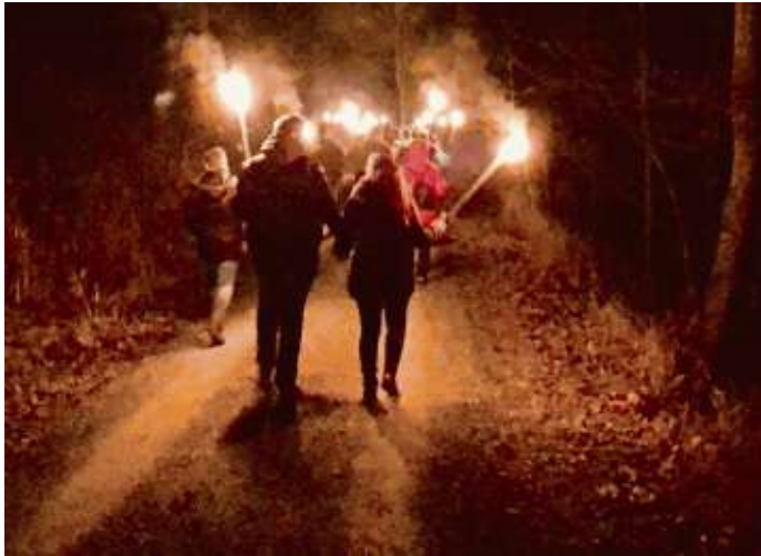
Alle Wanderfreunde können das Jahr mit einer Fackelwanderung beim Frankenwaldverein gemütlich ausklingen lassen.

Los geht es mit dem vorweihnachtlichen Kerzenabend des Frankenwaldvereins Bad Steben am Samstag, 30. November, um 19.30 Uhr im Großen Kurhausaal unter dem Motto „Advent is a Leucht'n“ ein. Es wirken mit: Männergesangsverein Lippertsgrün mit Solistin, Fränkisch Blech, Altbayreuther Stubenmusik, Holzrohrbläser Frankenwald. Die Eintrittskarten sind im Vorverkauf bei der Tourist-Information in der Wandelhalle (Tel. 09288/7470) erhältlich, Restkarten an der Abendkasse. Eintrittspreis: 11 Euro für alle Plätze.