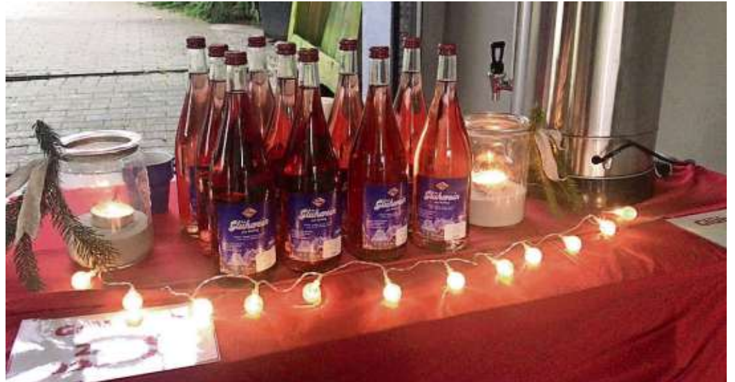
Im Ausschank: Der fränkische Glühwein kommt direkt vom Winzer.

Beim Advents-Shopping lässt sich vielerlei verbinden – ein Bummel durch Bad Steben, die vorweihnachtliche Stimmung bei Glühwein, Bier oder Lebkuchen und die entspannte Suche nach dem passenden Geschenk. So wird der 6. Dezember zum perfekten Tag für den Weihnachtseinkauf bei den regionalen Händlern.