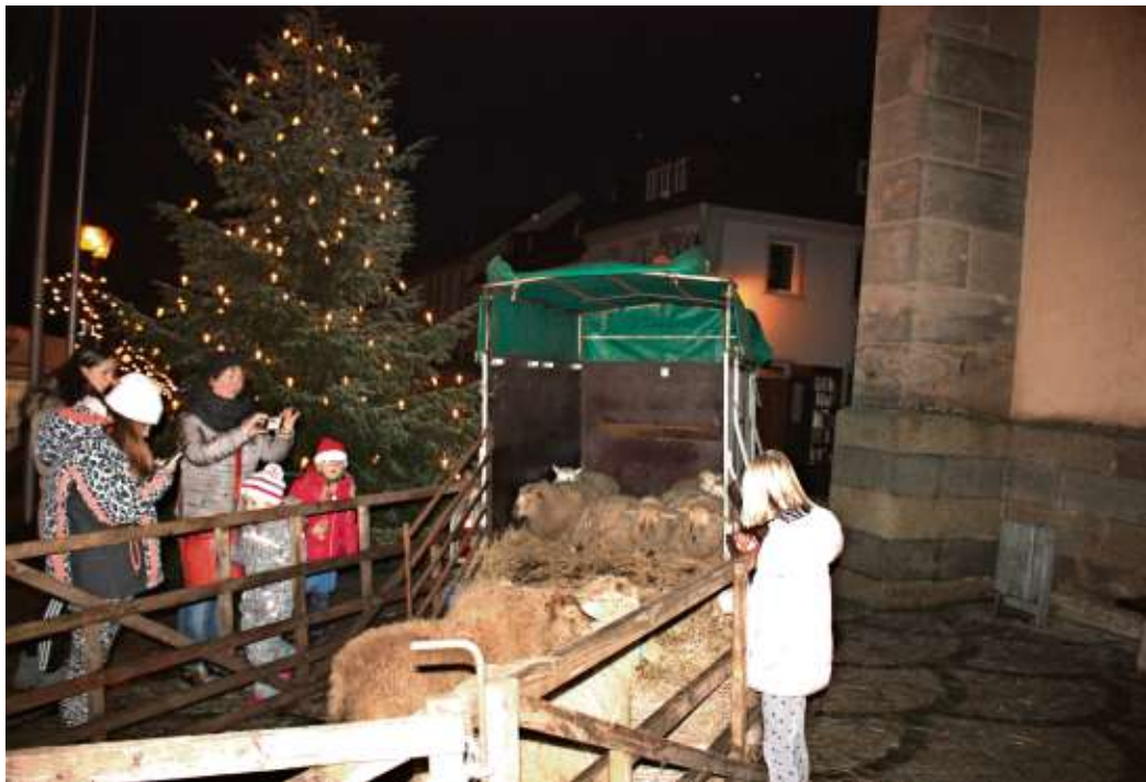
Einer der Höhepunkte im Rahmenprogramm ist die lebendige Krippe vor der evangelischen Stadtkirche.