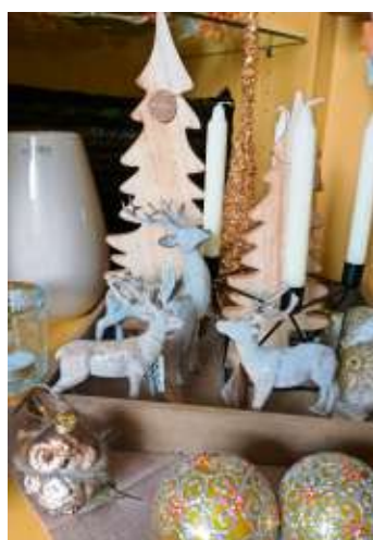
Hübsche Dekoideen gibt es beim Weihnachtsmarkt im Kaufhaus Horn