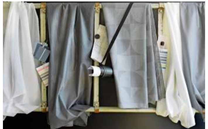
Stoffe der „Acoustic Line“ verbessern die Raumakustik.

Jacquardweberei. Eine breite Palette an sanft schimmernden Unis, zeitlosen Streifenvariationen, plakativen Mustern und raffinierten Ausschneidern stiften Freiraum für Kreativität. Denn die permanent schwerentflammaren Stoffe sind nicht nur schön, sondern leisten einen signifikanten Beitrag zur Verbesserung der Raumakustik. Durch den Einsatz von absorbierenden Spezialgarnen und dem Wissen um schallrelevante Bindungsstrukturen entstehen sogar im Bereich der se-