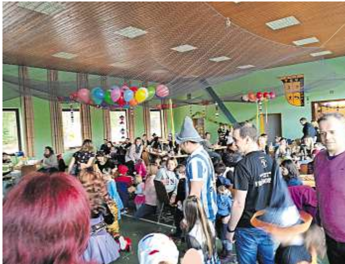
Am morgigen Samstag von 15.00 bis 18.00 Uhr lädt der TSV Dürrenwaid zum bunten Treiben ins Sportheim Silberstein ein.

Silberstein - „Silberstein – He-lau“ heißt es am Samstag, 9. Februar, für alle kleinen und großen Fans der fünften Jahreszeit. Unter der Regie der fünf Übungsleiterinnen des Kinderturnens vom TSV Dürrenwaid gemeinsam mit Alleinunterhalter Tom Sauer wird die Turnhalle im Sportheim Silberstein in eine Faschingsarena verwandelt und natürlich schallt die passende Musik durch den Raum. Bunt geschmückt mit vielen Luftballons und Luftschlangen passt sich die Halle den hoffentlich zahlreich kostümierten und maskierten Faschingsfreunden an, egal ob noch als Windelheld oder schon älteren Semesters. Alle sind willkommen. Den Faschingsmuffeln sei gesagt, dass Kostümierung keine Pflicht ist, aber dann doch gute Laune und Frohsinn sowie Spaß. Der närrische Fasching wird mit einer ganzen Reihe von Spielen gefeiert: ob nun mit den traditionellen, wie der Reise nach Jerusalem oder Schaumkusswettessen bis hin zu Schnüre schnappen und verschiedene Staffelspiele. Ganz klar, die Spiele werden dem Alter der Kinder angepasst und die gibt es dann auch, damit auch wirklich alle mitmachen