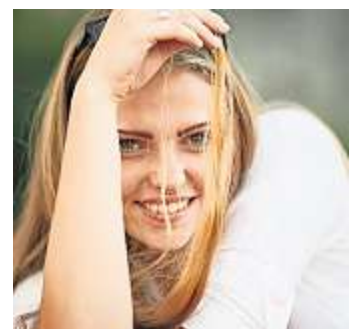
Der Workshop „Helden der Heimat“ findet am 16. März in Hof statt.

Kräfte in sozialen Organisationen und Verbänden, Bildungs- und Kultureinrichtungen, die mit Ehrenamtlichen arbeiten oder in Zukunft arbeiten möchten. Weitere Informationen zum Workshop, dem Wettbewerb und die (kostenfreie) Anmeldung unter www.oberfranken.heldenderheimat.de . Fragen beantwortet die Adalbert-Raps-Stiftung unter helden@raps-stiftung.de oder 09221/807 0.