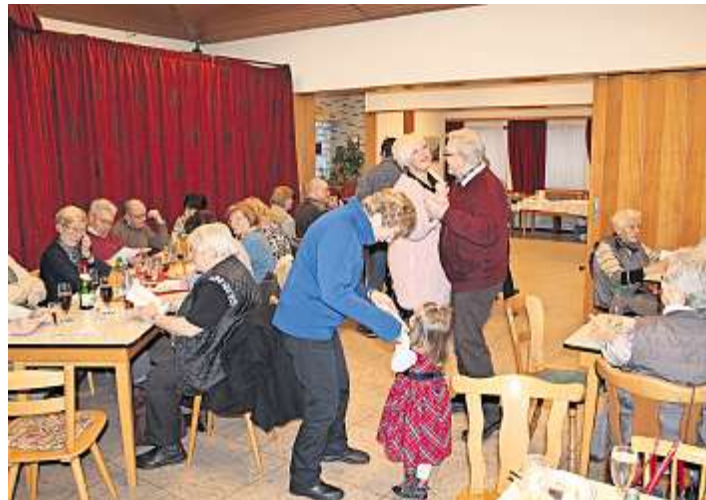
Im „Singcafé“ wird auch getanzt.

Schwarzenbach a.Wald - Wieder war „Singcafé-Time“ im Schwarzenbacher Marienheim, und die Resonanz war wie immer sehr groß.