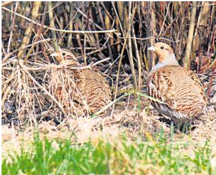
Ein selten gewordener Anblick, Rebhühner.

Naila - Die Bionachfrage wächst schneller als deren Produktion, berichtet die Ortsgruppe Frankenwald Ost des Bund Naturschutz in Bayern e.V.. Beste Voraussetzungen also für die Umstellung konventioneller Betriebe auf biologische Anbaumethoden und Tierhaltung. Im Jahr 2017 waren dies in Bayern 1.000 Höfe mit insgesamt 35.000 Hektar Fläche, die auf ökologischen Landbau umgestellt haben. Die Zahl dieser Biobetriebe wuchs damit um 14 Prozent auf insgesamt 8.400 mit Anstieg der Anbaufläche auf 270.000 Hektar. Bayern hat damit seinen Vorsprung als bundesweit bedeutendstes Bioland weiter ausge-