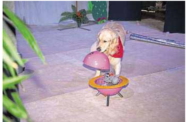
Gleich ist das Essen fertig: Golden Retriever Flori steht für seine Kumpels am Grill.

Selbitz - Nach zwei Jahren Pause eröffnet das „Hunds-Deooder“ der Selbitzer Hundeschule Wolfenstein erneut seine Pforten. Heuer stellen die sechs Vierbeiner ihre Vorbereitungen für eine gemeinsame Urlaubsreise vor. Die äußerst gelungene Premiere fand am vergangenen Sonntag in der alten Schulturnhalle in Selbitz statt. Wenn sechs Hunde auf Reisen gehen wollen, dann haben sie viel vorzubereiten. Von der Buchung der Reise im Reisebüro, über das Kofferpacken, bis zur Organisation des Verkehrsmittels. Am Meer angekommen, wird dem süßen Leben gefrönt. Der Verwandtschaft zuhause muss eine Ansichtskarte geschrieben werden. Die freie Zeit vertreibt man sich mit Mensch beziehungsweise Hund ärgere Dich nicht. Nach so vielen Aktivitäten knurrt der Magen. Seegetier muss gefangen werden und auf den Grill gebracht werden. Zum Mahl gibt es Weißbrot und für die „großen“ Hunde sogar Bayerisches Bier. Nachdem