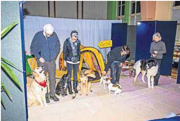
Flori, Quincy, Timon, Josy Cathy und Mila mit ihren Herrchen und Frauen nach der Show auf der Bühne.