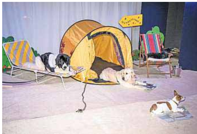
Am Strand ist auch für Hunde „Chillen“ angesagt.

Selbitz - Nach zwei Jahren Pause eröffnet das „Hunds-Deooder“ der Selbitzer Hundeschule Wolfenstein erneut seine Pforten. Heuer stellen die sechs Vierbeiner ihre Vorbereitungen für eine gemeinsame Urlaubsreise vor. Die äußerst gelungene Premiere fand am vergangenen Sonntag in der alten Schulturnhalle in Selbitz statt. Wenn sechs Hunde auf Reisen gehen wollen, dann haben sie viel vorzubereiten. Von der Buchung der Reise im Reisebüro, über das Kofferpacken, bis zur Organisation des Verkehrsmittels. Am Meer angekommen, wird dem süßen Leben gefrönt. Der Verwandtschaft zuhause muss eine Ansichtskarte geschrieben werden. Die freie Zeit vertreibt man sich mit Mensch beziehungsweise Hund ärgere Dich nicht. Nach so vielen Aktivitäten knurrt der Magen. Seegetier muss gefangen werden und auf den Grill gebracht werden. Zum Mahl gibt es Weißbrot und für die „großen“ Hunde sogar Bayerisches Bier. Nachdem