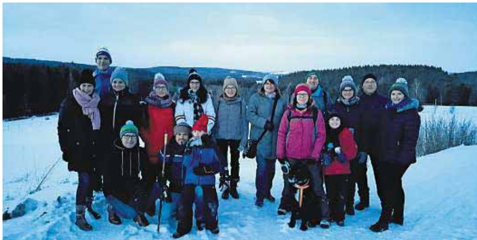
Das Foto zeigt den Großteil der Gruppe auf dem Radweg bei Döbrastöcken mit Blick in Richtung Lichtenberg.