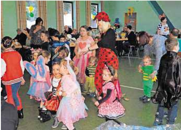
Tanzen zum Fliegerlied.