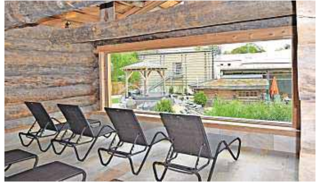
Großzügig gestaltet: Der Panorama Ruheraum der Sauna.

Bad Steben – Winter, Frost, klirrende Kälte: Für manche gibt es nichts Schöneres, als sich in der Sauna bei 70 oder 98 Grad aufzuwärmen. Die Therme Bad Steben hat mit ihrer Erweiterung der Saunalandschaft im August 2018 noch ein paar Attraktionen dazu bekommen – und überrascht den Gast mit speziellen Aufgüssen und Peelings. Salz-