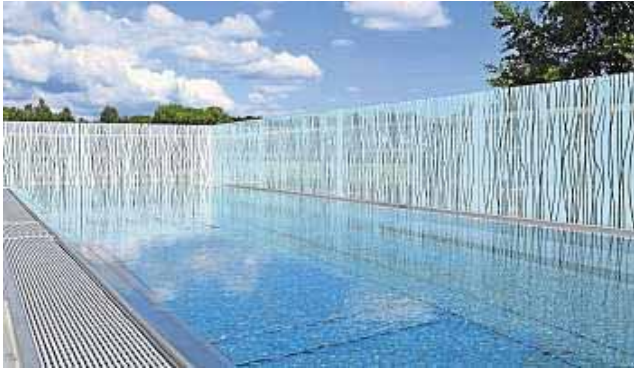
Entspannung nach der Sauna im 36 Grad warmen Sky-Pool.