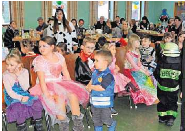
Ein beliebtes Partyspiel: Die Reise nach Jerusalem.

Dürrenwaid - Kinder, Kinder, da ging es rund beim Kinderfasching mit rund 70 Mädchen und Jungen im zarten Alter mit wackelig-balancierendem Gehversuchen bis hin zum coolen Teenager. Sie alle waren im Sportheim in Silberstein beim TSV Dürrenwaid mit Eltern und Großeltern.