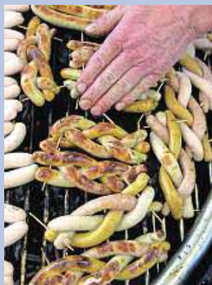
„Original Regional“ heißt die Kampagne unter der sich Hersteller typischer regionaler Lebensmittel bewerben können.

Im Mai wählt eine Jury zusammengesetzt aus Politik, Fachleuten und Medien die Gewinnerinnen und Gewinner aus. Ausgezeichnet werden die diesjährigen Originale im Oktober auf der Verbrauchermesse Consumenta in der NürnbergMesse. Im Rahmen eines öffentlichkeitswirksamen Auftritts erhalten sie den Titel „Unser Original“, mit dem sie fortan für ihr Produkt werben können. Alle Gewinnerinnen und Gewinner