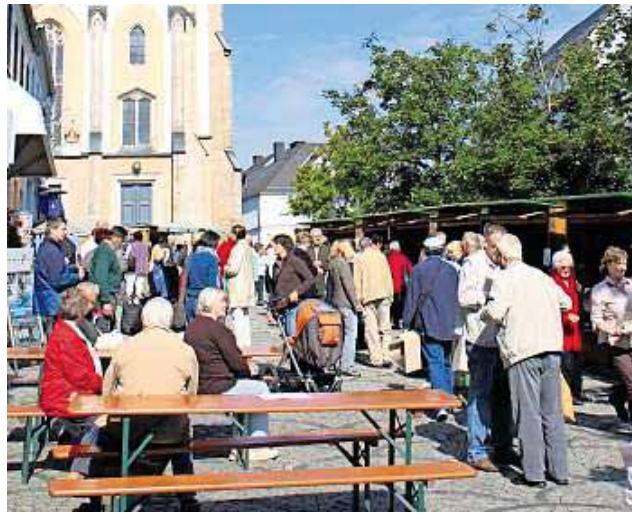
Spanferkel und fränkische Klöße - das ist neben den vielen regionalen Erzeugnissen die Spezialität beim Bauernmarkt am 02. März.

Naila - Er ist seit Jahren ein Besuchermagnet, der Bauernmarkt auf dem Marktplatz in Naila. Nicht nur die wechselnden saisonalen Angebote, sondern vor allem der direkte Kontakt zwischen Hersteller und Kunden ist für viele Verbraucher ein Grund, Monat für Monat vorbeizuschauen. Und auch die Anbieter nutzen die Gelegenheit, um mit den Käufern ins Gespräch zu kommen, können erklären, wie die Produkte und Preise entstehen. Zum sofortigen Genuss beim nächsten Bauernmarkt am Samstag, 2. März, gibt es ab 09.00 Uhr eine besondere kulinarische Spezialität: Spanferkel und fränkische Klöße. Darüber hinaus haben die