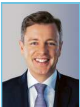
Liste 1 - CSU