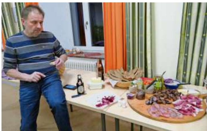
Bei den Proben ist auch immer Zeit für eine kleine Stärkung zwischendurch.

Die Gruppe fiebert schon den Aufführungen entgegen. Die Stimmung ist gut, die Texte sind abrufbereit. Nun geht es um die kleinen, aber wichtigen Details, um die passende Mimik und Gestik, um das Zusammenspiel.