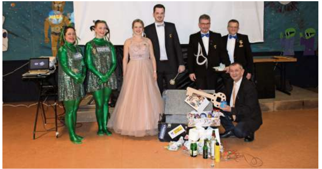
Die Regentschaft der Narren ist zu Ende: Bevor der Bürgermeister die Stadtkasse öffnen konnte, musste er den Schlüssel aus einem Glas mit Weltraumschleim herausfischen.