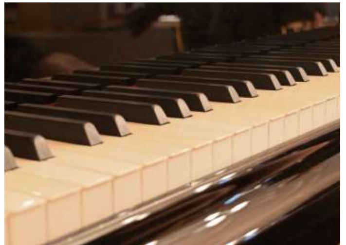
Die Nachwuchspianisten laden heute Abend zum Abschlusskonzert.