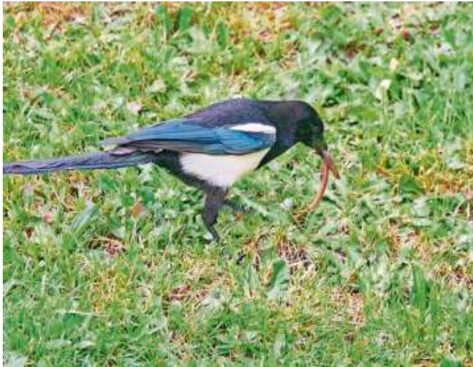
Allerlei Vögel, wie hier eine Elster, lassen sich die Würmer schmecken

Frankenwald - Der Name täuscht, mit Regen hat dieser Wurm nichts zu tun, schreibt die Ortsgruppe Frankenwald Ost des Bund Naturschutz in einer Pressemitteilung. Im Mittelalter war er noch der „rege“ Wurm, was als Wortstamm erhalten blieb, weil er augenscheinlich nie ruht und ständig gräbt und frisst. Der Regenwurm kann auch ohne Luftsauerstoff atmen, weshalb er nicht so schnell in der Erde ertrinken kann. Er kommt bei Regen nur unfreiwillig an die Oberfläche, um vermeintlich seinem größten Fressfeind, dem Maulwurf zu entkommen, da die Regentropfen vom Wurm ähnlich wie dessen Grabgeräusche wahrgenommen werden. Dies nutzt auch die Amsel, die sich hüpfend wie ein Känguru über den Rasen bewegt und dadurch ebenfalls die Regenwürmer herauslockt. Erwischt sie einen und zieht, ist das kein ungleicher Kampf, denn der rege Wurm kann bis zum Sechzigfachen seines Eigengewichtes an Kraft aufbringen. Die Würmer können drei bis acht Jahre alt werden. Darunter auch bunte Schönheiten, wie der smaragdgrüne Regenwurm. Und in dieser Gattung gibt es Riesen, so schaffte es ein Wurm aus Südafrika 1967 sogar ins Guinness-Buch der Rekorde: 1,8 Meter lang bei zwei Zentimeter Durchmesser konnte er sich bis 6,7 Meter lang ausdehnen und war fast 1,5 Kilo schwer. Aber auch in Deutschland gibt es Riesenwürmer, die nur im Hochschwarzwald vorkommen: Der Badische Riesenregenwurm ist dort eine ende-