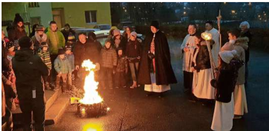
Vor der Kirche wurden die Palmzweige verbrannt, die Asche gesegnet und den Gläubigen aufgelegt.