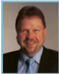
Reiner Feulner 49 Jahre Erster Bürgermeister Schwarzenbach a.Wald