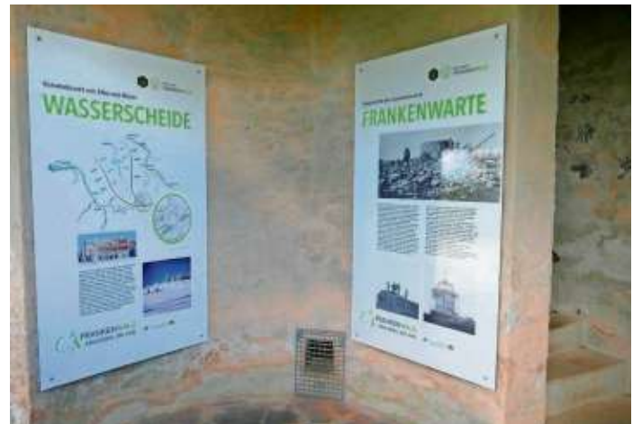
Panoramatafeln an den „Fensteröffnungen“ erläutern, was zu sehen ist.