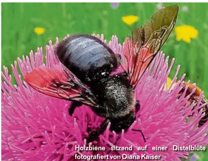
Holzbiene sitzend auf einer Distelblüte