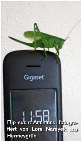
Flip sucht Anschluss