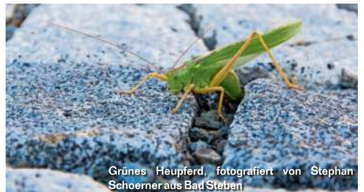
Grünes Heupferd