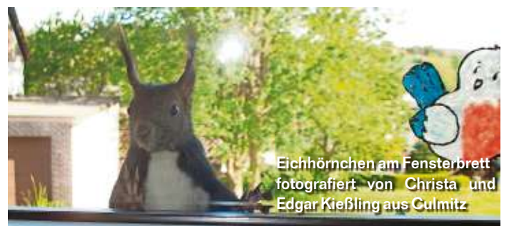
Eichhörnchen am Fensterbrett