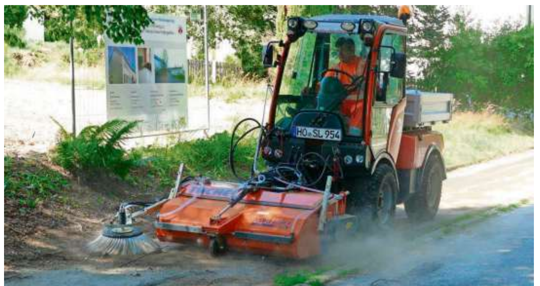
Von der Spende wurde unter anderem eine Kehrmaschine für den städtischen Bauhof angeschafft.

„Ihr habt einen wesentlichen Anteil durch eure Arbeiten und durch eure Spende an der Beschaffung der Kehrmaschine“, betonte von Waldenfels, der sich schon jetzt auf die sauberen Straßen und Gehwege entlang der städtischen Grundstücke freut. „Die Wirkung ist deutlich“, stellte der Bürgermeister nach der Reinigungsvorführung fest und erhielt reihum Zustimmung.