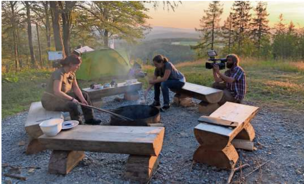
Für einen Filmdreh kam das Team von SAT.1 Bayern in der Frankenwald.