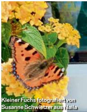
Kleiner Fuchs