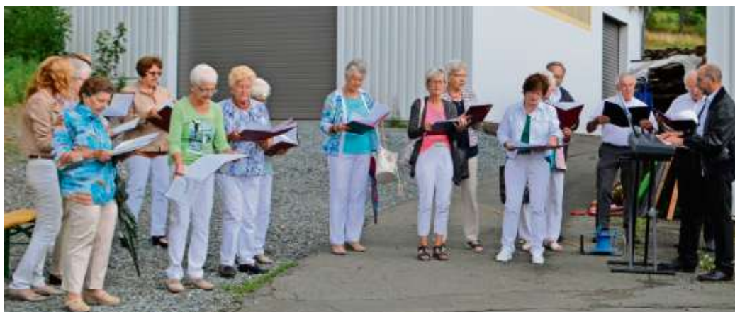
Der Kirchenchor sang zum Abschied

gern. Gemeinsam sitzt man am Tisch, teilt die Gaben, reicht die Speisen weiter und jeder wird gesättigt.